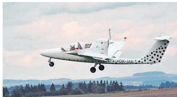
Letadlo na elektřinu dostali do vzduchu.

Vysoké učení technické v Brně pokročilo ve vývoji elektricky poháněného letounu. Stroj s označením VUT 051 RAY ve středu poprvé vzlétl.