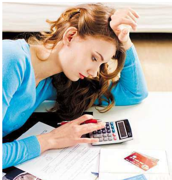
Peníze budete muset přidat i ze svého.

Čeští studenti mají v rámci Erasmu největší zájem o studium v Německu. Dále je nejvíce přitahují Francie a Španělsko. METRO