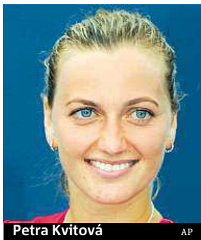
Petra Kvitová

V New Yorku dnes startuje US Open. Na něm se ukáže hned pět Čechů: Jiří Veselý, Lucie Šafářová, Radek Štěpánek, Tereza Smitková a Kristýna Plíšková. RB