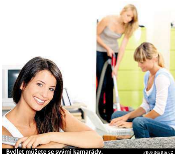
Bydlet můžete se svými kamarády.

Nejvíce bytů ke studentskému nájmu nabízí Brno, kde je k nalezení téměř stejně inzerátů s nájmem bytů cíleným vyloženě na studenty jako v Praze. Praha letos přijme tradičně nejvíce studentů - necelých 117 tisíc, Brno od září přijme téměř 80 tisíc vysokoškoláků a cílí na ně přes 3700 internetových inzerátů s nabídkou nájmu.