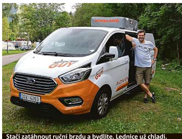
Stačí zatáhnout ruční brzdou a bydlíte. Lednice už chladí.