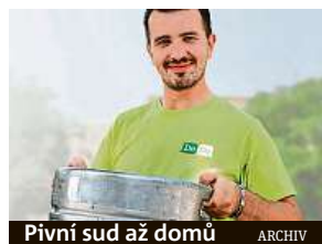
Pivní sud až domů