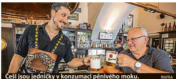
Češi jsou jedničky v konzumaci pěnivého moku. MAIRA

Lucemburčané a Švýcaři předběhli Čechy v množství pivovarů na počet obyvatel.