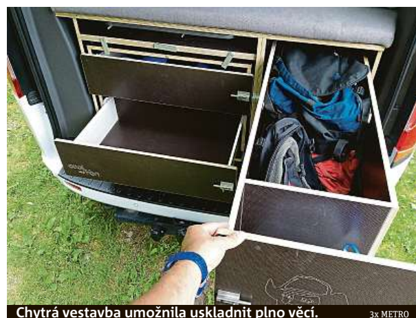
Chytrá vestavba umožnila uskladnit plno věcí.