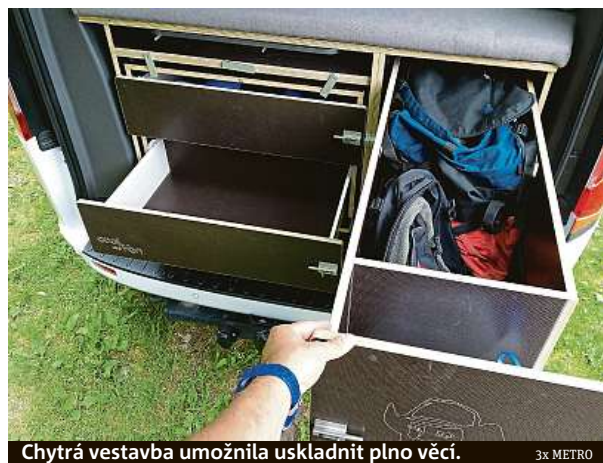
Chytrá vestavba umožnila uskladnit plno věcí.