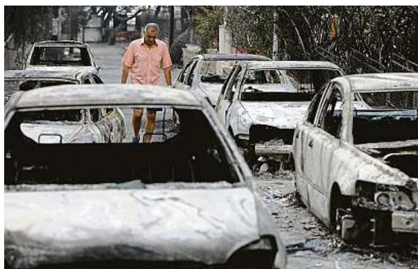
Ohnivý plameny pustošily Řecko dva dny.