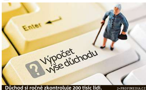
Důchod si ročně zkontroluje 200 tisíc lidí.

Žádost lze podat písemně i elektronicky. Písemná žá-