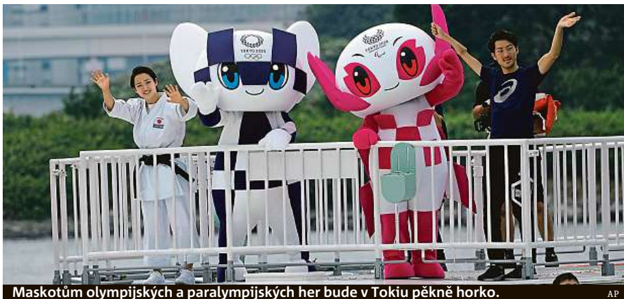
Maskotům olympijských a paralympijských her bude v Tokiu pěkně horko.

V pondělí vyšplhala rtuť v Tokiu na rekordních 41 stupňů, a i když to se za dva roky při zahájení her asi nebude opakovat, meteorologové varují před teplotami, které mohou být nebezpečné pro sportovce i diváky. Červencový průměr v Tokiu je 26,5 stupně, třicítka nejsou výjimkou a každoročně na následky přehřátí organismu v Japonsku zemře více než tisíc lidí. Když japonská metropole hostila hry v roce 1964, bylo to v podstatně chladnějších