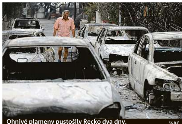
Ohnivý plameny pustošily Řecku dva dny.