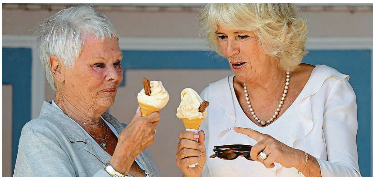
Britská herečka Judi Densch (vlevo) si včera na ostrově Wight užívala kornout zmrzliny ve společnosti vévodkyně Camilly.

Verdikt. Týká se zhruba šedesáti rodin. „Zůstáváme.“ Odstěhovat se odmítají, často nemají kam STRANA 4