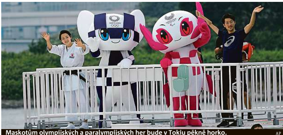
Maskotům olympijských a paralympijských her bude v Tokiu pěkně horko.

V pondělí vyšplhala rtuť v Tokiu na rekordních 41 stupňů, a i když to se za dva roky při zahájení her asi nebude opakovat, meteorologové varují před teplotami, které mohou být nebezpečné pro sportovce i diváky. Červencový průměr v Tokiu je 26,5 stupně, třicítka nejsou výjimkou a každoročně na následky přehřátí organismu v Japonsku zemře více než tisíc lidí. Když japonská metropole hostila hry v roce 1964, bylo to v podstatně chladnějších