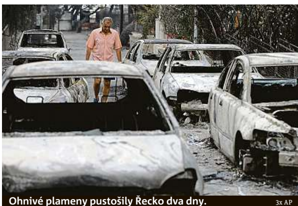
Ohnivě plameny pustošily Řecko dva dny.