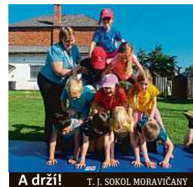
A drží! T. J. SOKOL MORAVIČANY

Česká obec sokolská poskytla všem členům Sokola návodná videa na to, jak lidské pyramidy nacvičit a na co si dát po-