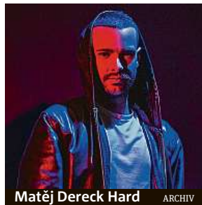
Matěj Dereck Hard ARCHIV

Právě proto, že hrají jakési přízraky, které do přírody chodí hlavně za účelem, aby si tam udělaly fotku na sociální síť a pak se jí chlubil. Jako by neměly k přírodě ten pravý