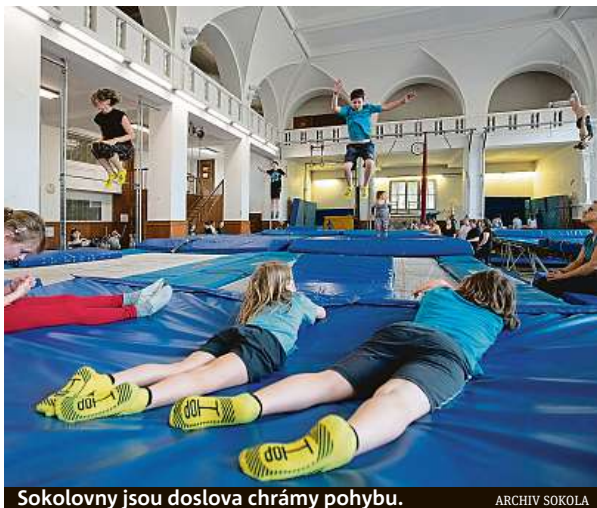
Sokolovny jsou doslova chrámy pohybu.