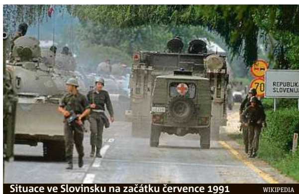
Situace ve Slovinsku na začátku července 1991

Jugoslávii, zemi považovanou za studené války za most mezi Východem a Západem, držela pohromadě nejen obava ze SSSR, ale též potlačování etnického napětí.