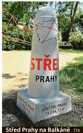
Střed Prahy na Balkáně

Naše soustředění nikdy nebylo jen na podvody. Ze stovek videí, co jsme o Praze natočili, byla jen hrstka o podvodcích, ale chápu, že české diváky to přitahovalo nejvíce, neb jste asi nikdy nekoukal na video, jak si koupit v Praze