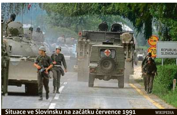
Situace ve Slovinsku na začátku července 1991

Jugoslávii, zemi považovanou za studené války za most mezi Východem a Západem, držela pohromadě nejen obava ze SSSR, ale též potlačování etnického napětí.