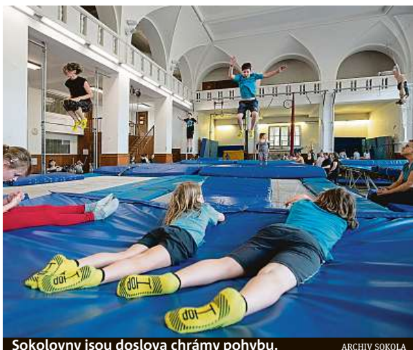
Sokolovny jsou doslova chrámy pohybu.