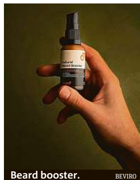
Beard booster. BEVIRO

„Náš výrobek je tu od toho, aby prokrvil pokožku, stimuloval folikuly vousů, dodal jim energii a tím pomohl pro-