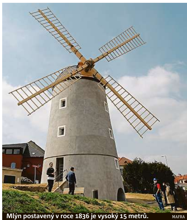
Mlýn postavený v roce 1836 je vysoký 15 metrů.