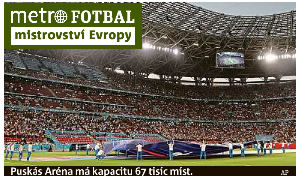
Puskás Aréna má kapacitu 67 tisíc míst.