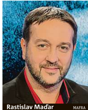
Rastislav Maďar MAFRA

Zápas Česka a Nizozemska na fotbalovém Euru slibuje skvostný zážitek, na stadionu v Budapešti zřejmě bude „plný dům“.