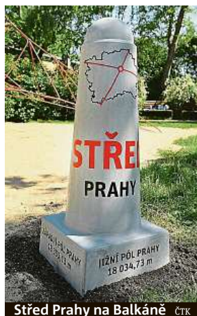
Střed Prahy na Balkáně

Naše soustředění nikdy nebylo jen na podvody. Ze stovek videí, co jsme o Praze natočili, byla jen hrstka o podvodcích, ale chápu, že české diváky to přitahovalo nejvíce, neb jste asi nikdy nekoukal na video, jak si koupit v Praze