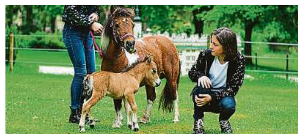
Novorozené hříbátko s maminkou

Program v Boheminiu začne již ráno a potrvá celý den.