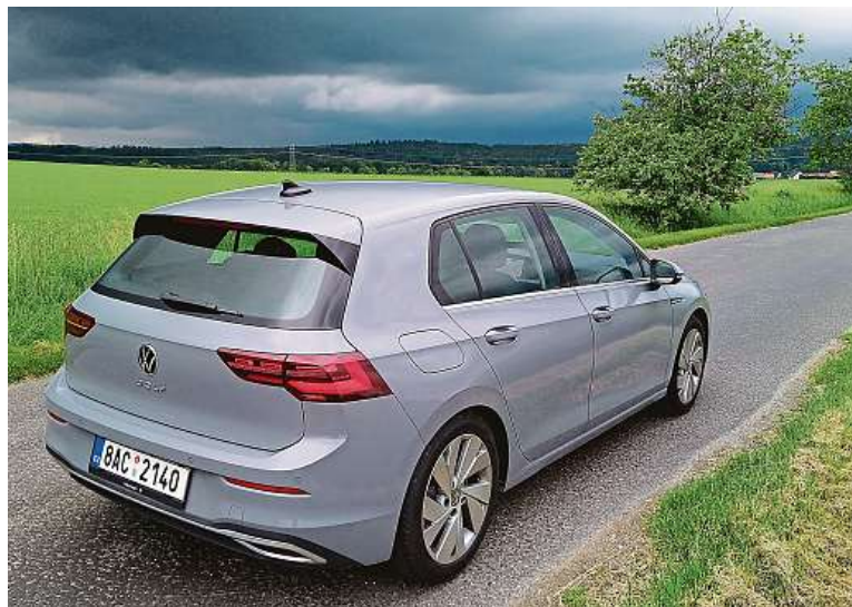
Velký zadní sloupek odkazuje i na předchozí generace: tohle je prostě Golf.