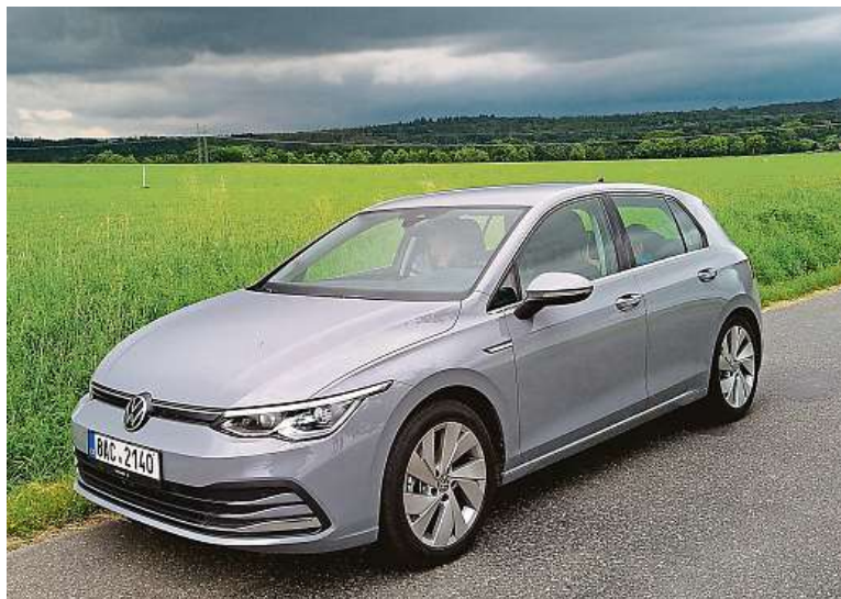
Sedá barva mu sekne. I když je pod mrakem a blíží se bouřka.