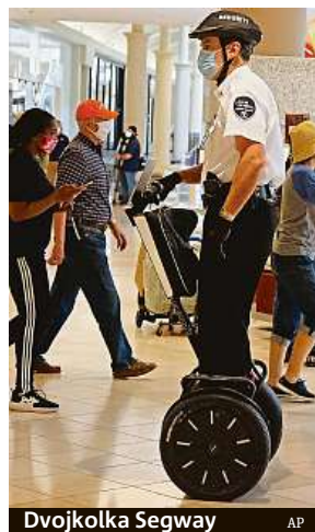
Dvojkolka Segway AP

Dopravní revoluce, kterou oznámil vynálezce vozítka Dean Kamen při založení firmy v roce 1999, se nestala realitou. Původní cena segwaye kolem 5 tisíc amerických dolarů (118 tisíc korun) byla pro mnoho zákazníků překážkou. V některých městech byla vozítka nakonec zakázána kvůli bezpečnosti. ČTK