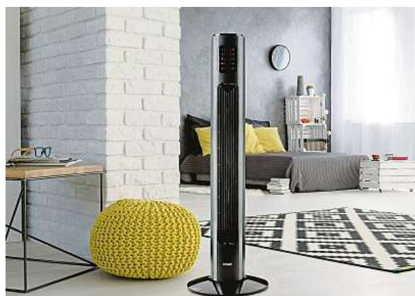
Účinný sloupový ventilátor

Nám do oka padl model DOMO DO8124, který je zástupcem zlaté střední třídy a v kompaktním designu nabízí nastavitelnou rychlost i typ ventilace, časovač, automatickou oscilaci a pro abso-