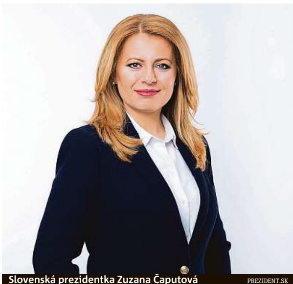
Slovenská prezidentka Zuzana Čaputová

Slovensko se díky včas zavedeným restriktivním opatřením v Evropě řadí k zemím s velmi nízkým výskytem ne-