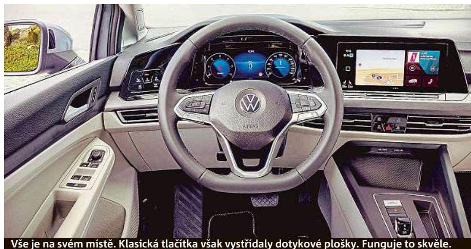
Vše je na svém místě. Klasická tlačítka však vystřídaly dotykové plochy. Funguje to skvěle.

BOJÍTE SE RÁDI? TEMNÁ ZÁKOUTÍ POZNEJTE NA METRO.CZ