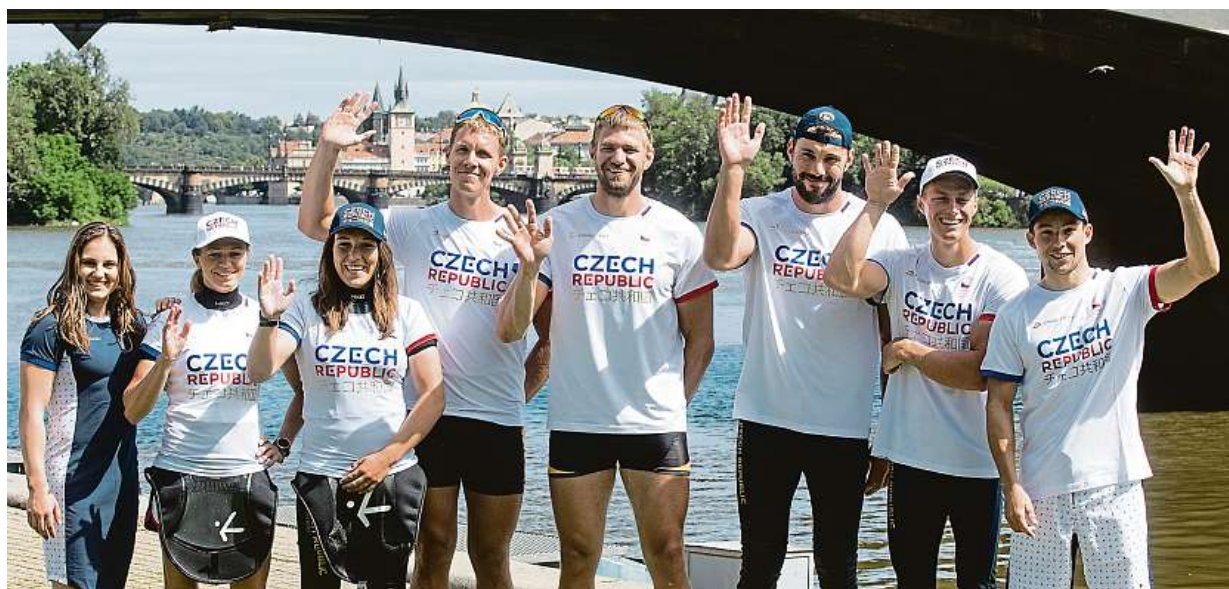
Ceský olympijský výbor včera představil další část kolekce pro hry v Tokiu. Více čtete na straně 11.

Srdeční arytmie. Pokud se jí podaří podchytit včas, mají nemocní šanci žít relativně bezproblémově. Léky. Warfarin, či dražší medikamenty NOAC? Zdravotnictví. Úspory by mu přinesla změna životního stylu STRANA 2