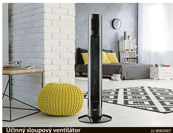
Účinný sloupový ventilátor

Nám do oka padl model DOMO DO8124, který je zástupcem zlaté střední třídy a v kompaktním designu nabízí nastavitelnou rychlost i typ ventilace, časovač, automatickou oscilaci a pro abso-