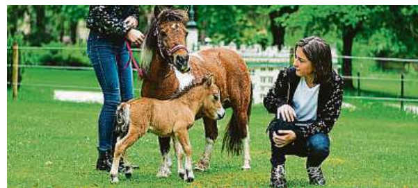
Novorozené hříbátko s maminkou

Program v Boheminiu začne již ráno a potrvá celý den.