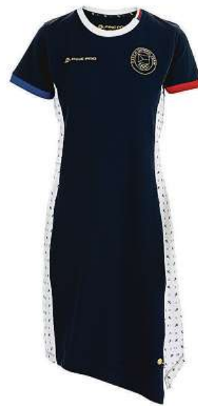
Šaty do Tokia pro ženy