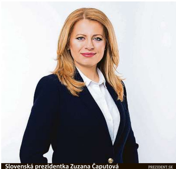
Slovenská prezidentka Zuzana Čaputová

Slovensko se díky včas zavedeným restriktivním opatřením v Evropě řadí k zemím s velmi nízkým výskytem ne-