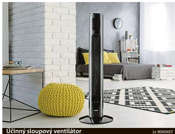
Účinný sloupový ventilátor

Nám do oka padl model DOMO DO8124, který je zástupcem zlaté střední třídy a v kompaktním designu nabízí nastavitelnou rychlost i typ ventilace, časovač, automatickou oscilaci a pro abso-