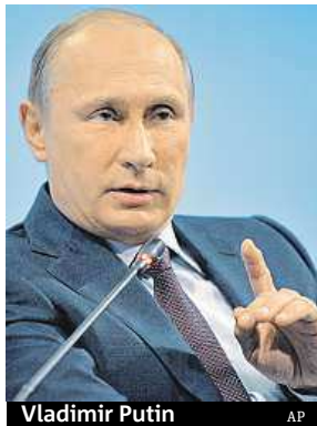
Vladimir Putin

Předpověď nástupu Putina k moci nevnímá Vojnovič jako věštění, jde jen o vyvození logických závěrů z pozorování života v SSSR na sklonku