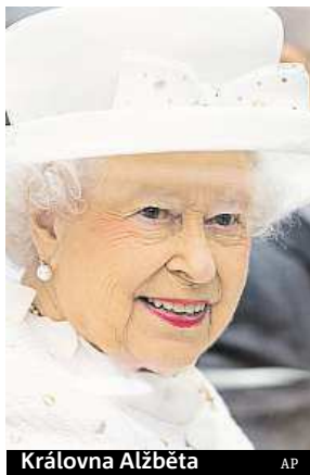
Královna Alžběta

Poslední účty ukazují, že královně bylo za loňský rok vyplaceno celkem 37,9 milionu liber, z nichž utratila 35,7 milionu. Příspěvek se podle BBC letos zvýší na 40,5 milionu liber a předpokládá se, že příští rok vzroste na 42,8 milionu. METRO