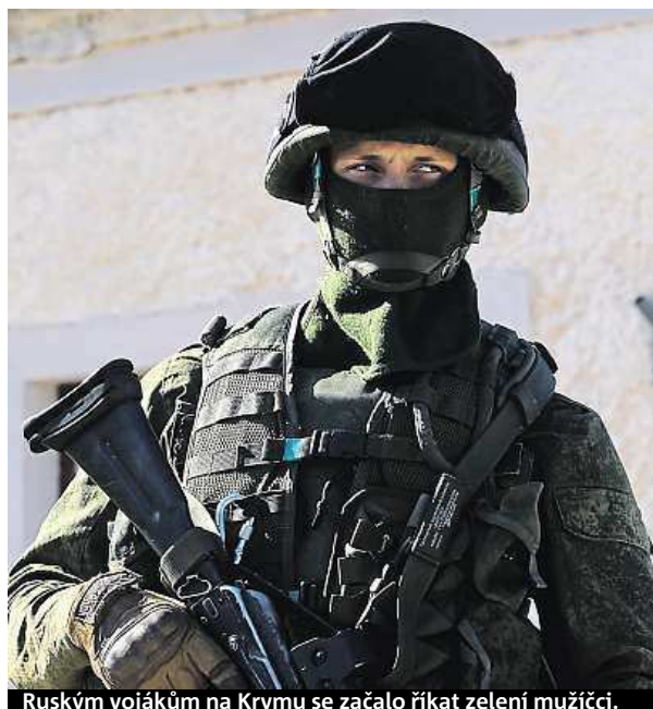
Ruským vojákům na Krymu se začalo říkat zelení muži.

V žádném případě nelze dávat rovnítko mezi událostí z Československa roku 1968 a současnou událostí na Ukrajině. Svět se mezi tím zásadně změnil. Přesto lze pojmenovat některé velmi podobné rysy. Jak v roce 1968, tak v loňském roce na Krymu došlo k vojenské intervenci na cizím území s tím, že tato agrese byla řízena z Moskvy. Tím došlo k nezpochybnitelnému porušení mezinárodního práva. Sovětský svaz, respektive nyní Rusko tak opakovaně prosazovaly svou imperiální tradici v zemích, které považovaly „za své“. Další paralelou je masivní propaganda, která agresi provází. Přitom velmi často odkazuje na fašismus.