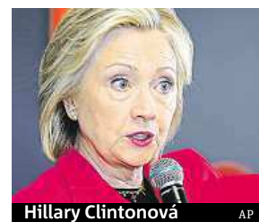
Hillary Clintonová

Demokratická kandidátka na amerického prezidenta Hillary Clintonová vyzvala všechny americké firmy, aby zastavily prodej veškerého zboží, na němž je kontroverzní vlajka Konfederace, symbol otrokářských jižanských států z dob občanské války v letech 1861 až 1865. Vlajka je podle ní symbolem někdejšího rasismu v zemi a nemá místo v současných USA. Opatření proti propagaci prodeje sporné vlajky v úterý ohlásil i nejpoužívanější internetový vyhledávač na světě Google. ČTK