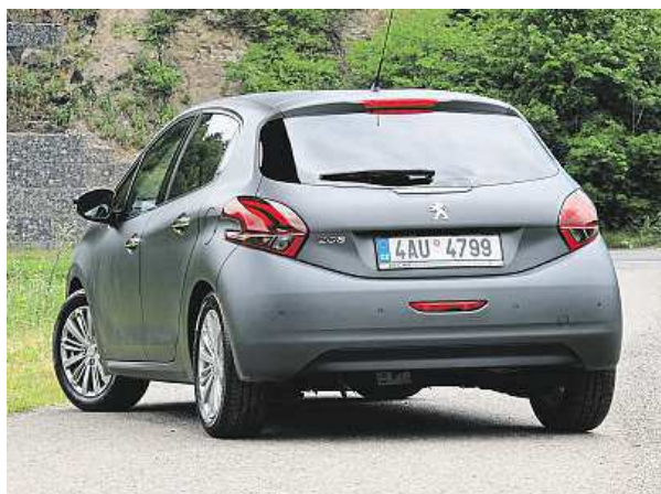
Peugeot lakuje nový model 208 také matnou šedou barvou, která se cenově neliší od perleťové.