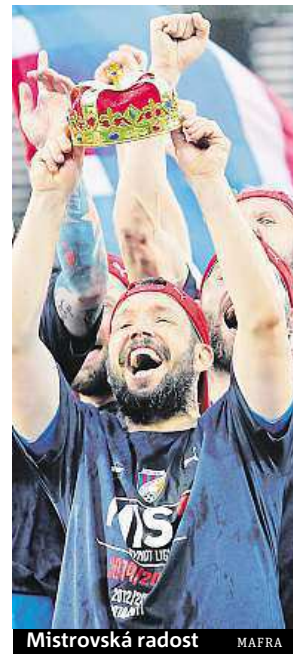
Mistrovská radost MAFRA

Fotbalová sezona v Česku začne už 18. července, kdy je na programu Superpohár. V něm se utkají mistrovská Plzeň, která bude utkání pořádat, a vítěz poháru Liberec. Ještě v týdnu předtím vstoupí Mladá Boleslav do 2. předkola Evropské ligy, a to 16. července proti lepšímu z dvojice Partizani Tirana–Strömsgodset. Plzeň, Sparta, Jablonec a Liberec zahájí cestu do evropských pohárů až ve třetím předkole. IDNES.cz