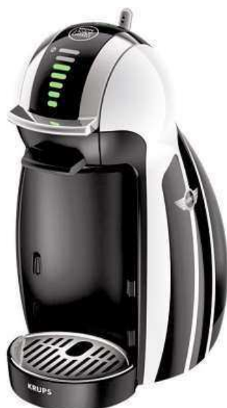
KÁVOVAR NA KAPSLE KRUPS KP161M GENIO 2 LTD EDITION MINI **