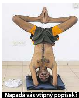
Napadá vás vtipný popisěk?

Napište bublinu a reagujte na sloupek na: www.facebook.com/denikmetro