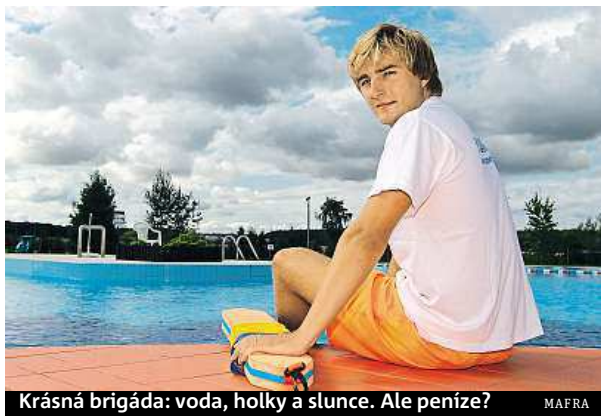
Krásná brigáda: voda, holky a slunce. Ale peníze? MAFRA

Kancelář řádkové inzerce: Václavské náměstí 1, palác koruna, Praha 1, po-čt 8-18 hod., pá 8-17. Tel: 225 065 177, 178, fax: 225 066 653