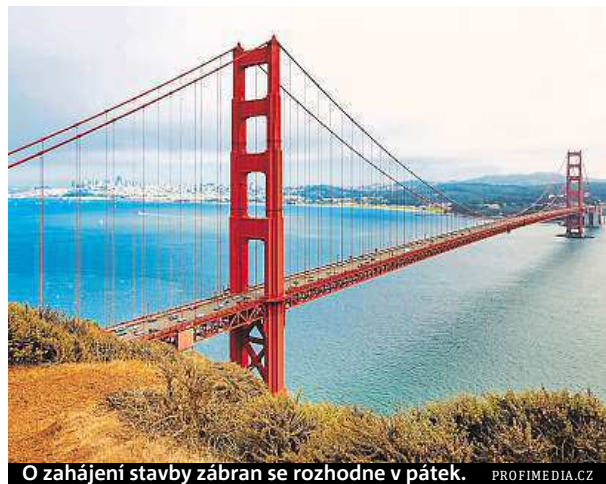
O zahájení stavby zábran se rozhodne v pátek. PROFIMEDIA.CZ

kdo zemře, když skočí,“ odhadl šéf úřadu zodpovídajícího za provoz mostu Dennis Mulligan. Kvůli této černé bilanci sehnal úřad z různých zdrojů 76 milionů dolarů (přes 1,5 miliardy korun), které mají pokrýt náklady na vybudování „protisebevražedných“ bariér. ČTK