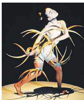
Svěcení jara M. CHOUINARDOVÁ

Vrcholem letošního festivalu Tanec Praha je účast kanadské choreografky a tanečnice Marie Chouinardové. Této umělkyni je dokonce věnována speciální pocta. Chouinardová, jež do Česka zavítá vůbec poprvé, se svým souborem uvede dnes a zítra večer v Hudebním divadle Karlín dvě představení, a to The Rite of Spring/Svěcení jara a Henri Michaux: Mouvements. Zítra od 10.30 do 13 hodin ještě zatančí sólo In Museum ve Veletržním paláci v Praze. METRO