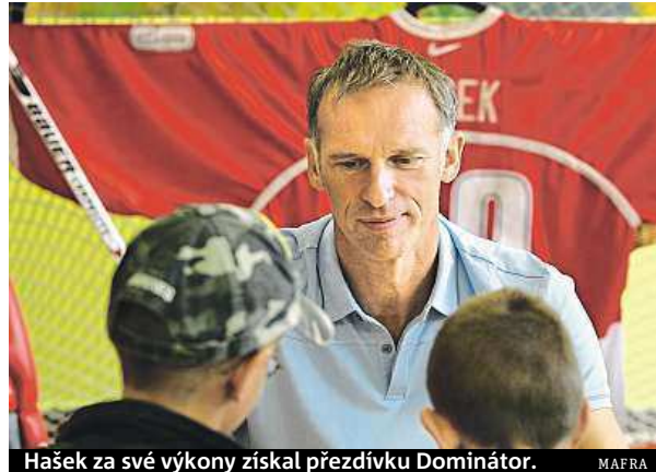
Hašek za své výkony získal přezdívku Dominátor.

Hokejový brankář Dominik Hašek se stane prvním Čechem, kterého uvedou do Síni slávy NHL. Stane se tak v listopadu.