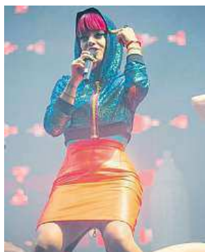
Ska-popová uličnice Allen a Belgičan Stromae

„Sziget je nejlepší festival vůbec. Úžasný, bláznivý, zábavný. A strávit několik dní mimo normální svět za tu cenu stojí,“ píše na TripAdvisoru Ital, který si říká RodoTurin, a připomíná tak známý fakt, že budapeštská týdenní show je populární mezi lidmi z celé Evropy. Více než polovina návštěvníků totiž pochází