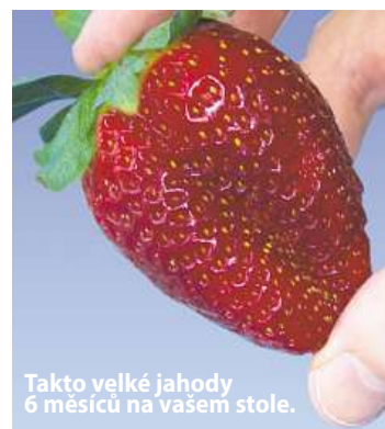
Takto velké jahody 6 měsíců na vašem stole.

Ano, nyní se již nepotřebujete ohýbat, abyste sbírali na zemi a v blátě jahody, které napadli živočichové ještě předtím, než byly zralé.