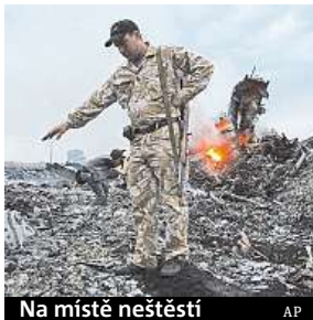
Na místě neštěstí

Vyšetřovatelé dospěli k závěru, že odpalovací zařízení bylo součástí 53. brigády ruské protivzdušné obrany. Rusko však popírá, že by se na