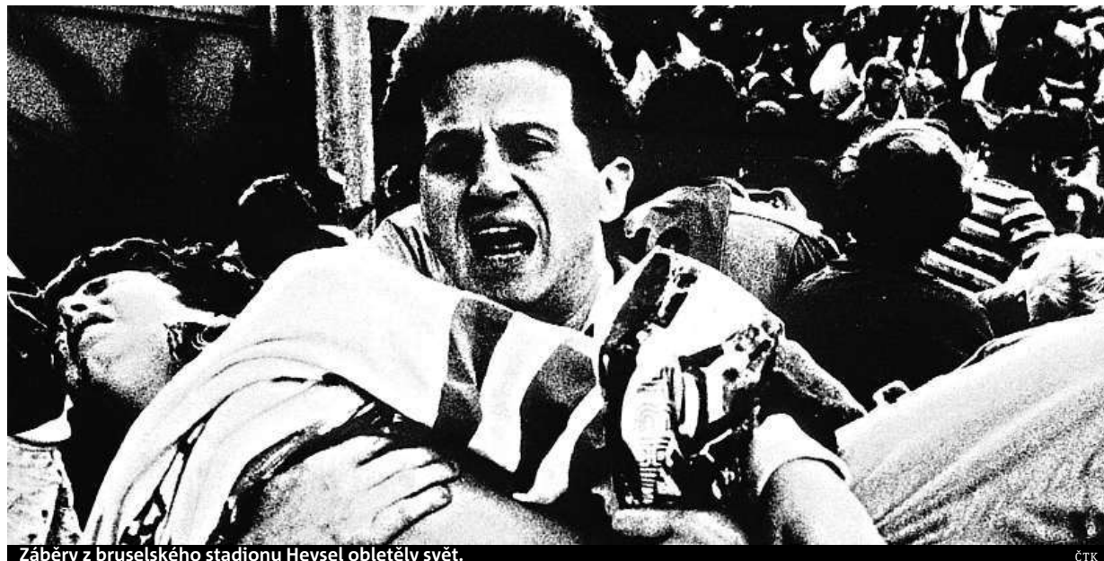
Záběry z bruselského stadionu Heysel obletěly svět.