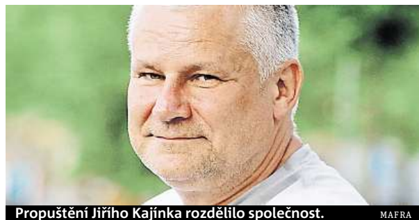
Propuštění Jiřího Kajínka rozdělilo společnost.

Dalším hostem Rádia Impuls vrah Jiří Kajínek. Mluvil se o spekulacích, které panují kolem jeho prezidentské kandidatury. „Já jsem nevyhlásil žádnou kandidaturu, neřekl jsem, že budu kandidovat. Právně kandidovat samozřejmě můžu, ale já nejsem člověk, který by měl podobné ambice, navíc jsem soudný,“ řekl Kajínek. Zároveň ale dodal, že neustále potkává lidi, kteří mu projevují podporu a chtěli by ho volit. Přiznal, že může časem podlehnout náhlání svých fanoušků. „Uvidíme. Ni-