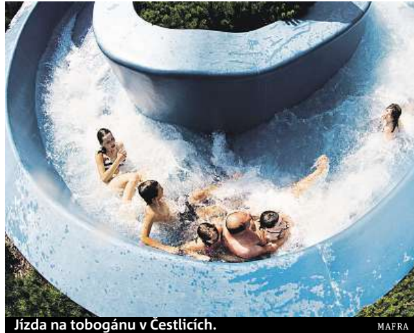
Jízda na tobogánu v Čestlicích.

Velkým lákadlem akvaparku je podle něj každodenní večerní Laser show, vodní Coral Bar obsluhující plavce přímo ve vodě či dvoupatrové fitness-centrum, které patří mezi nejlépe vybavené v Česku. Největším zařízením své