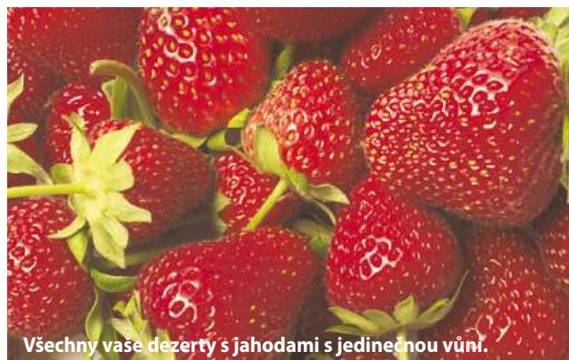
Všechny vaše dezerty s jahodami s jedinečnou vůní.