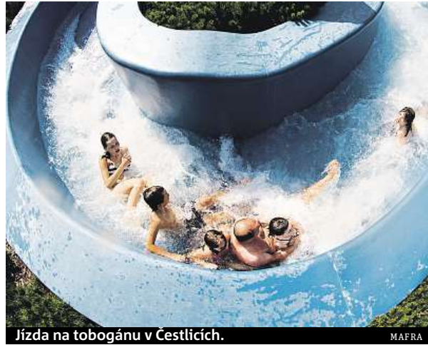
Jízda na tobogánu v Čestlicích.

Velkým lákadlem akvaparku je podle něj každodenní večerní Laser show, vodní Coral Bar obsluhující plavce přímo ve vodě či dvoupatrové fitness-centrum, které patří mezi nejlépe vybavené v Česku. Největším zařízením své