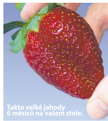
Takto velké jahody 6 měsíců na vašem stole.

Ano, nyní se již nepotřebujete ohýbat, abyste sbírali na zemi a v blátě jahody, které napadli živočichové ještě předtím, než byly zralé.