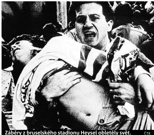
Záběry z bruselského stadionu Heysel obletěly svět.