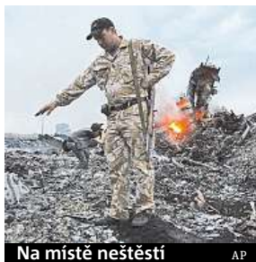
Na místě neštěstí

Vyšetřovatelé dospěli k závěru, že odpalovací zařízení bylo součástí 53. brigády ruské protivzdušné obrany. Rusko však popírá, že by se na