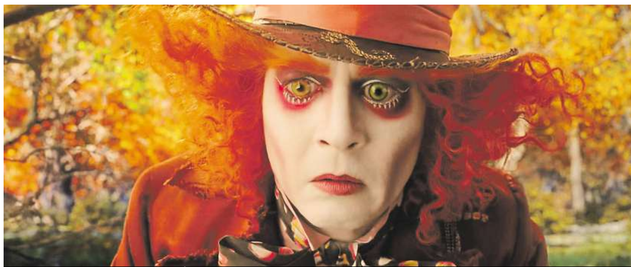
Zítřejší kin film Alenka v říši divů: Za zrcadlem. V roli Kloboučníka se objeví Johnny Depp (na snímku).

Je tu léto, doba oprav kolejí. Pracovat se bude na menším počtu tramvajových tratí než v loňském roce. Největší akce. Nejrozsáhlejší opravy – Nuselská a U Plynárny. Centrum. Bez tramvají také v Ječné STRANA 2