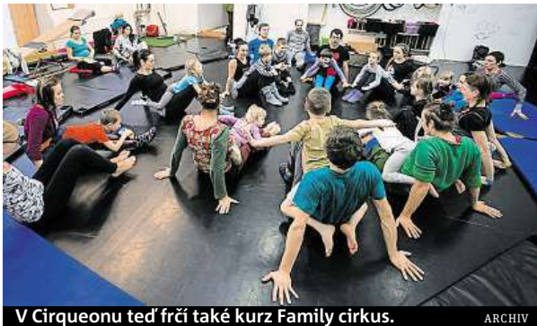
V Cirqueonu teď frčí také kurz Family cirkus.