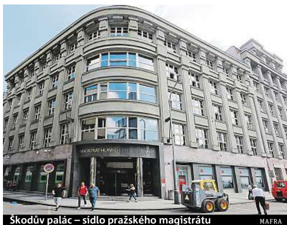
Škodův palác – sídlo pražského magistrátu

Málokde proběhlo hledání nového sídla bez problémů. Důkazem je nové sídlo magistrátu i některá sídla městských částí.