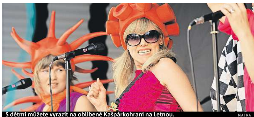
S dětmi můžete vyrazit na oblíbené Kašpárkohrani na Letnou.