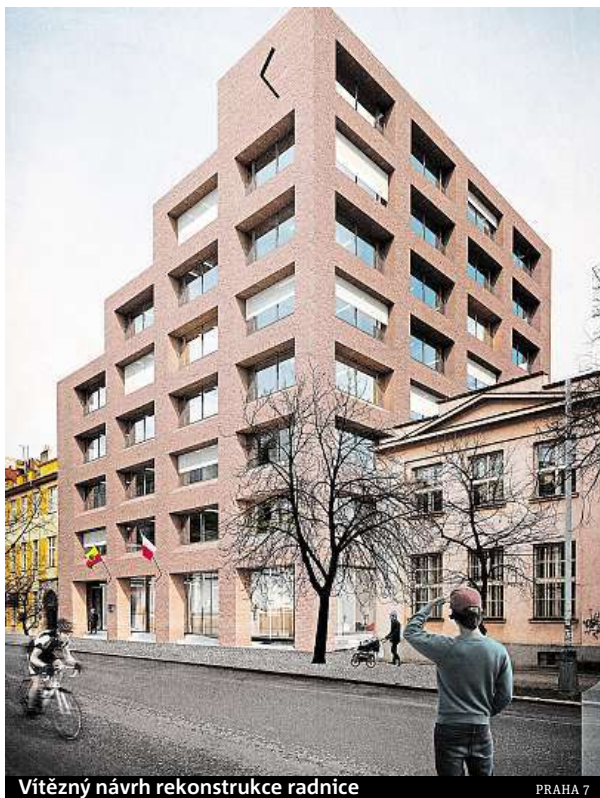
Vítězný návrh rekonstrukce radnice