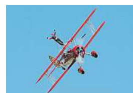
Do vzduchu za 500 Kč

Akrobacie bude vyhrazena odborníkům, ale do vzduchu se dostanou i návštěvníci.