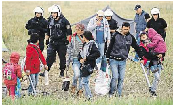
Uprchlíci opouštějí tábor v Idomeni.

Mnoha uprchlíků se ale přesun do jiných táborů neliší. „Jsme tady už tři měsíce a v táborech budeme muset strávit nejméně šest dalších,“ zoufá si uprchlice z Damašku