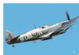
Spitfire slaví 80 let.

Snad nejproslavenější britský stíhač letoun všech dob, to je Supermarine Spitfire.