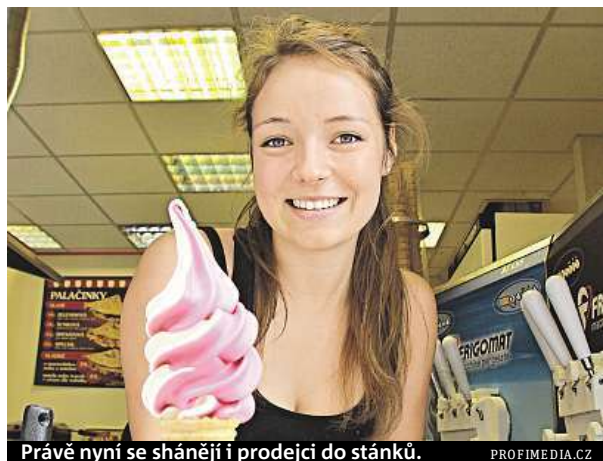
Právě nyní se shánějí i prodejci do stánků.

Při hledání letní brigády je přitom vhodné sledovat různé informační zdroje. Pro brigády v administrativě se vyplatí procházet pracovní portály nebo nabídku zveřejňovanou personálními agenturami, pro brigády ve výrobních