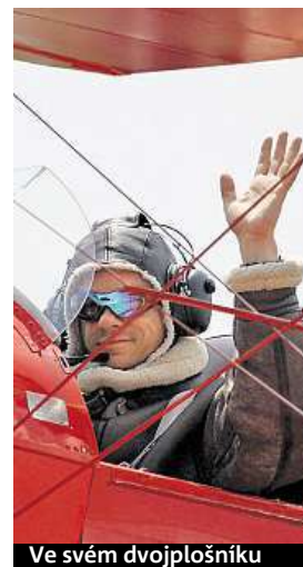
Ve svém dvojplošníku