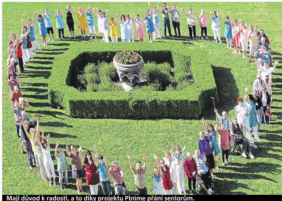
Mají důvod k radosti, a to díky projektu Plníme přání seniorům.

ni se týkalo právě vybudování nového altánu. Přání oslovilo širokou veřejnost a na kontě se během čtyř týdnů sešlo 100 procent potřebných financí. V Lysé nad Labem tak mohou slavit.