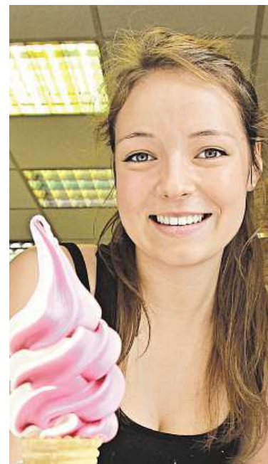
Shánějí se i prodejci.

Zájmců o sezonní práce je i kvůli nízké nezaměstnanosti méně než dřív.