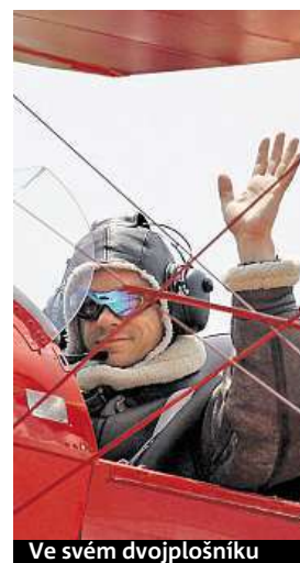
Ve svém dvojplášniku