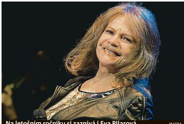
Na letošním ročníku si zazpívá i Eva Pilarová.

Pořadatelé Metronome Festivalu, jehož čtvrtý ročník proběhne na Výstavišti ve dnech 21. a 22. června, připravili pro návštěvníky unikátní koncert – komponované vystoupení vybraných nejpozoruhodnějších českých zpěvaček několika žánrů. V rámci koncertu zazpívá legenda českého swingu a popu Eva Pilarová, začátky její kariéry sahají do 60. let, nebo kytaristka a šansoniérka Lenka Filipová, která se stala hvězdou na začátku osmé dekády 20. století. Generaci, jež se dostala do povědomí fanoušků po roce 1989, zastoupí Anna K. nebo Monika Načeva a nejmladší krev českého ženského popu