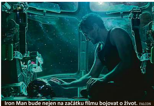
Iron Man bude nejen na začátku filmu bojovat o život. FALCON

„Hrozivé události způsobené Thanosem, který vyhladil polovinu života ve vesmíru a silně oslabil Avengers, vedou zbylé superhrdiny k tomu, aby ve strhujícím finále 22 filmů studia Marvel zvaném Avengers: Endgame