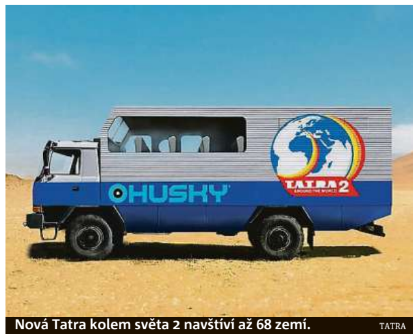
Nová Tatra kolem světa 2 navštíví až 68 zemí.

Pro expedici se připravuje speciální Tatra 4x4, která svým vzhledem naváže na původní vůz T 815 GTC. Bude hotová v září a pak se vydá na ukázkovou jízdu. HOP