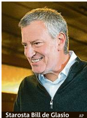
Starosta Bill de Blasio

Stávající skleněné mrakodrapy budou podle de Blasiova návrhu muset projít úpravami, aby splňovaly přísnější pravidla a normy pro uhlíkové emise. „Při výstavbě nových výškových budov budou moci firmy použít více skla jen tehdy, splní-li zároveň požadavky na snížení emisí. Ale budovat svoje památníky, které škodí zemi a ohrožují naši budoucnost, to už v New Yorku nebude možné,“ uvedl starosta. V nej-