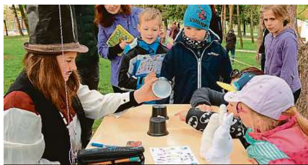
Sobotní Den Země může oslavit celá rodina. ARCHIV

Tuto sobotu v 11 hodin se v Malešickém parku rozběhne ekologická připomínka Dne Země. Atrakce a hry, které se uzavřou v 18 hodin, připraví skoro 20 organizací se zaměřením na životní prostředí. Tak třeba: malešická botanická zahrada otevře svůj zahradnický koutek, lesníci z Lesů hlavního města Prahy budou učit poznávání stromů, z živočišné říše dorazí živé slepice, papoušci a koníci huculové, kteří budou připraveni děti povozit. Akce končí tombolou a slosováním o malešické ceny. Více na malesice.eu/denzeme .