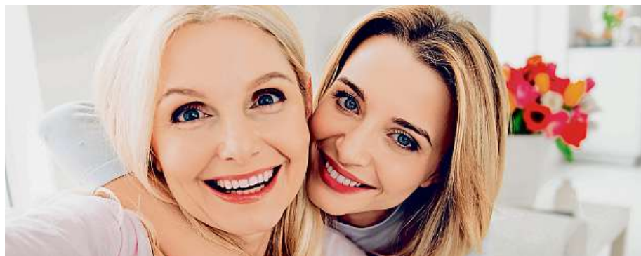
Den matek letos vychází na 12. května.

V některých zemích je svátek spojen s konkrétním datem – například Poláci ho slaví 26. května. MET