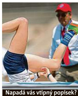
Napadá vás vtipný popisec?

Napište bublinu a reagujte na sloupek na: www.facebook.com/denikmetro