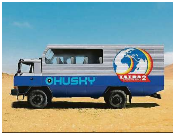
Nová Tatra kolem světa 2 navštíví až 68 zemí.

Pro expedici se připravuje speciální Tatra 4x4, která svým vzhledem naváže na původní vůz T 815 GTC. Bude hotová v září a pak se vydá na ukázkovou jízdu. HOP