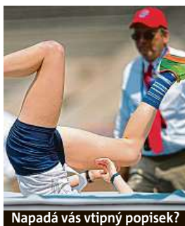
Napadá vás vtipný popisec?

Napište bublinu a reagujte na sloupek na: www.facebook.com/denikmetro