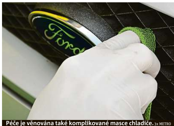
Péče je věnována také komplikované masce chladiče.

Nechali jsme si umýt auto od firmy, do které vkládá naděje tenisová legenda Radek Štěpánek.