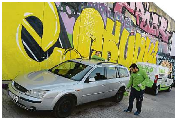
Dokážou umýt i staré auto, na kterém se podepsal čas?