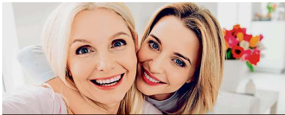
Den matek letos vychází na 12. května.

V některých zemích je svátek spojen s konkrétním datem – například Poláci ho slaví 26. května. MET