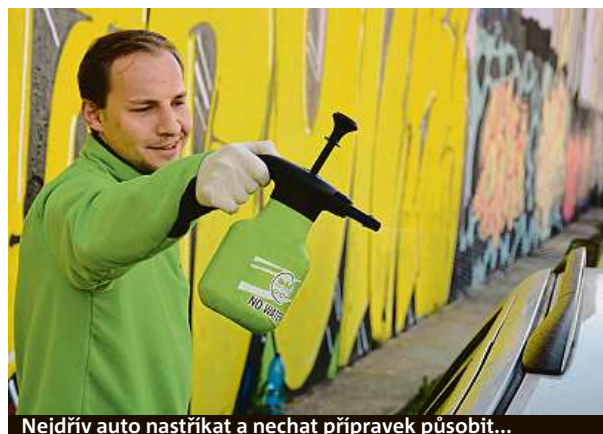
Nejdřív auto nastříkat a nechat přípravek působit...

• Mýcí cyklus v klasické myčce stojí od 120 do 250 korun. Mnoho z nich přitom vyměnilo nešetrné kartáče z polyetylenových žíní za měkké pěnové. Bývají označovány termíny carlite, softechs, gentle touch a podobně.