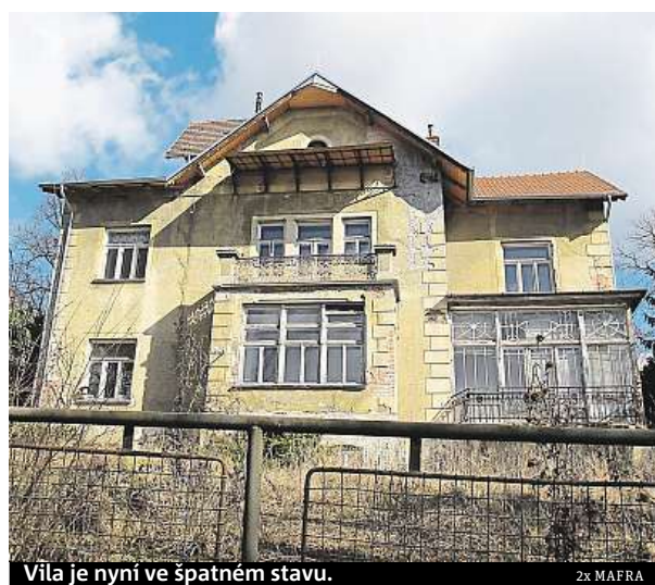
Vila je nyní ve špatném stavu. Zx MAFRA

před několika lety dosloužila jako mateřská škola. Děti z ní musely odejít kvůli špatnému stavebnímu stavu a nevhovujícím hygienickým podmínkám.