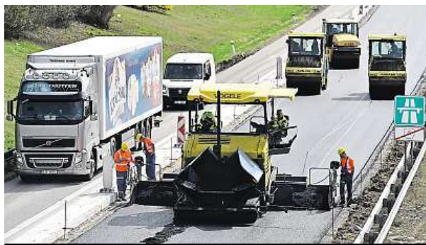
Práce probíhají i na dálnici D1 směrem na Prahu.

Zásahy záchranářů komplikují v Brně rozsáhlé práce na silnicích a s tím spojené uzavírky. Kvůli tomu se prodlužuje doba dojezdu k pacientovi i jeho odvoz do zdravotnického zařízení. Zdržení jsou převážně v minutách, někdy ale vůz zůstane stát v koloně a nemůže se hnout.