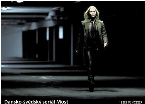
Dánsko-švédský seriál Most