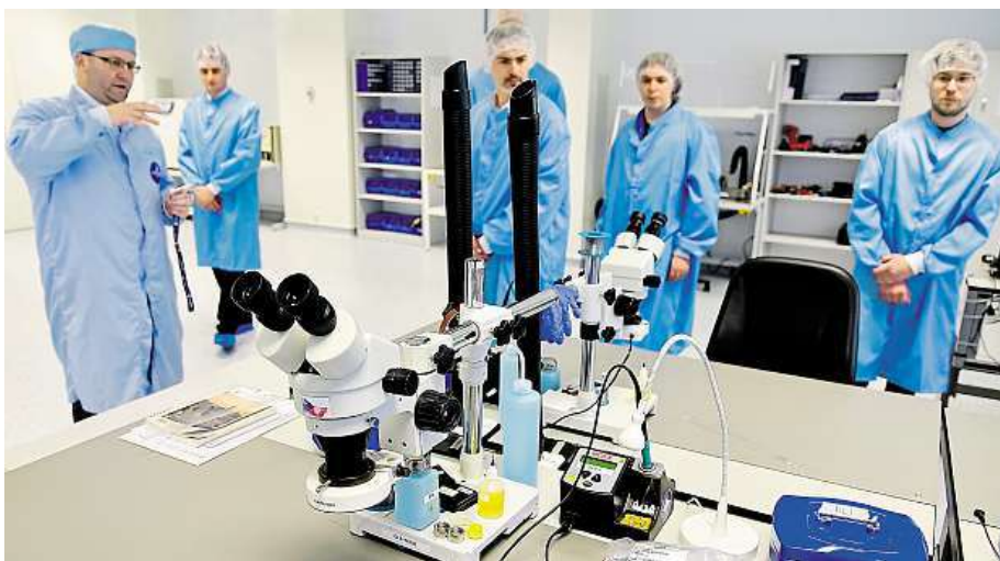
Pracoviště, kde se kompletují elektronické obvody družice

V hale jsou tři specializované laboratoře. Dvě z nich budou sloužit k výrobě elektroniky, kabeláže, menších zařízení a pozemních podpůrných vybavení. V další místnosti s výškou sedm metrů bude firma s pomocí velkého jeřábu montovat větší části. Jeden z prvních projektů, na kterém budou odborníci v novém prostoru pracovat, je vývoj vrchní části evropské rakety VEGA. Takzvaný dispen-