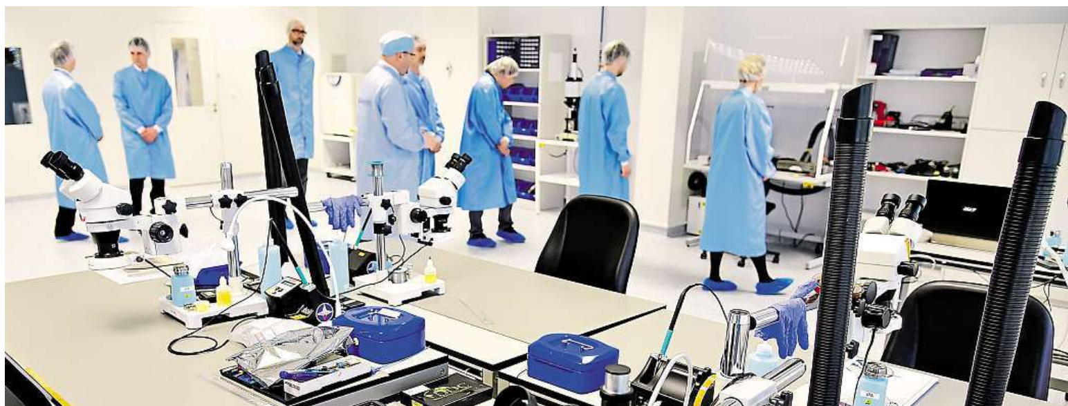
Hi-tech Brno. Firma S.A.B. Aerospace má novou halu, v níž budou odborníci montovat mimo jiné velké části do vesmírných raket a satelitů. Více na straně 10

Hledejte. Organizátoři vyzývají obyvatele, aby našli historické fotky a podělili se o rodinnou story STRANA 2