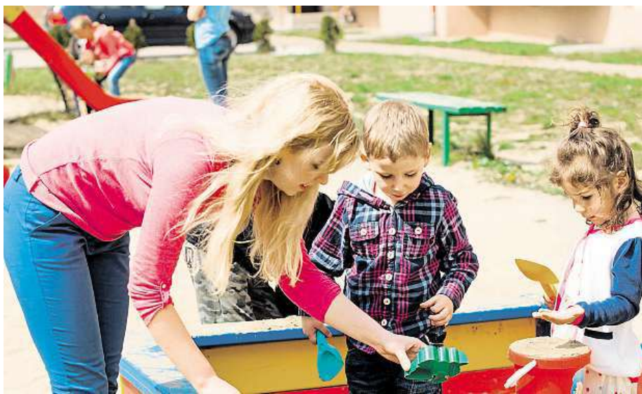
Brno-sever následuje moderní digitální trendy.