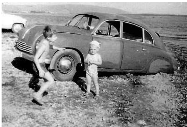
Sdílení fotografií a vzpomínek probíhá na webu republikafotky.cz.

stoleté výročí samostatnosti a devadesát let od otevření brněnského výstaviště. Už nyní se do něj však může zapojit kdokoliv zasláním vlastní fotografie.