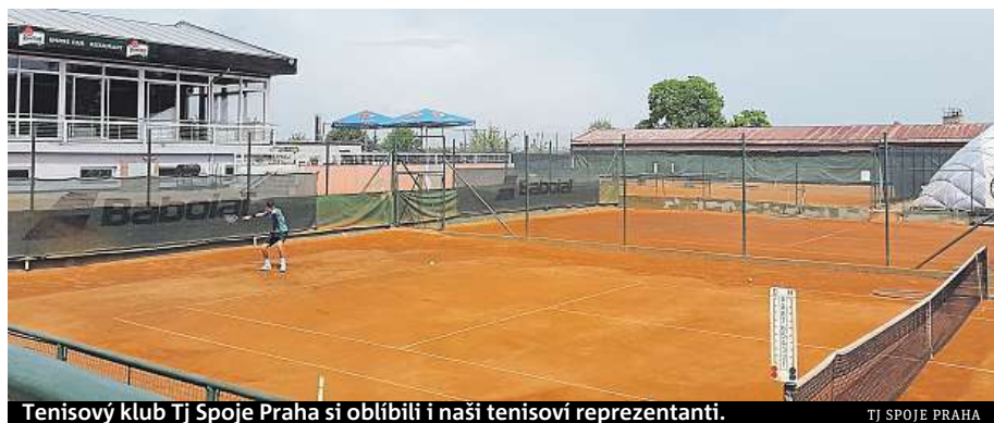
Tenisový klub TJ Spoje Praha si oblíbili i naši tenisoví reprezentanti.