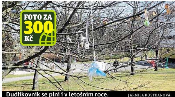
Dudlíkovník se plní i v letošním roce.

Neobvyklé dřeviny v hlavním městě vyrůstají znovu a znovu. Typickým příkladem je skupinka stromů v Centrálním parku v Praze 13, kterou nějaký vtipálek ozdobil podprsenkami. „Už jste v Metru ukázali dudlíkovník nebo škrpálovník. My zase máme na Lužinách podprsenkovníky,“ usmívá se čtenář Jiří Červenka. FILIP JAROŠEVSKÝ