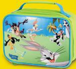
Dvačinný box Kačer Dufly, Jary Bugs Bunny, Dylvesten, Lola Bunny