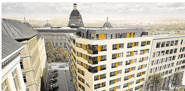
Rezidence U Muzea je další z luxusních možností. CENTRAL GROUP