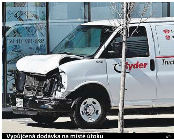
Vypůjčená dodávka na místě útoku