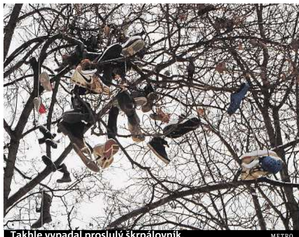
Takhle vypadal proslulý škrpálovník.