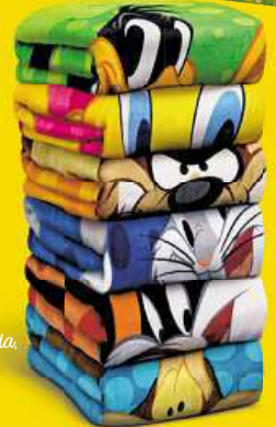
Plážová osuška Kačer Dufly, Kojot Wilda, Jary Bugs Bunny, Tweety, Dylvesten

NASBÍREJ CELOU VÝBAVU LOONEY TUNES A UŽIJ SI PARÁDNÍ PRÁZDNINY.