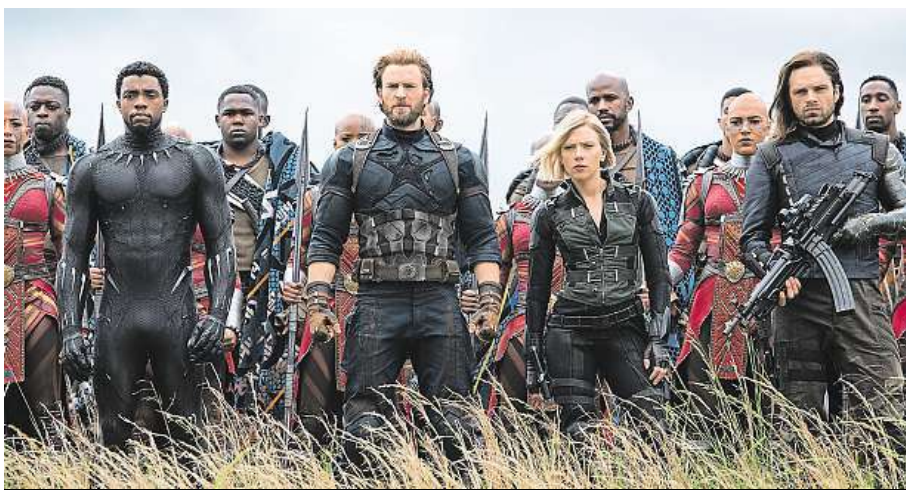
Avengers: Infinity War završuje desetiletou cestu filmovým světem studia Marvel. FALCON

Série superhrdinských komiksových filmů, jejíž pokračování s přídomek Infinity War si zítra odbyde premiéru i v českých kinech, je podle něj jen jednou z řady příhod vyvinutých mužů bez rodin. „Ti kolem sebe po dvě hodiny šíří smrt a boří města,“ podotkl na adresu dobrodruž-