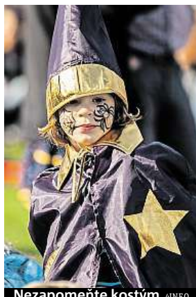
Nezapomente kostým 4INFO

Výběr z programu: Divadlo Mazec, jarmark, Den otevře-