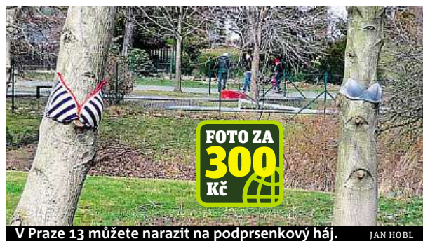
V Praze 13 můžete narazit na podprsenkový háj.