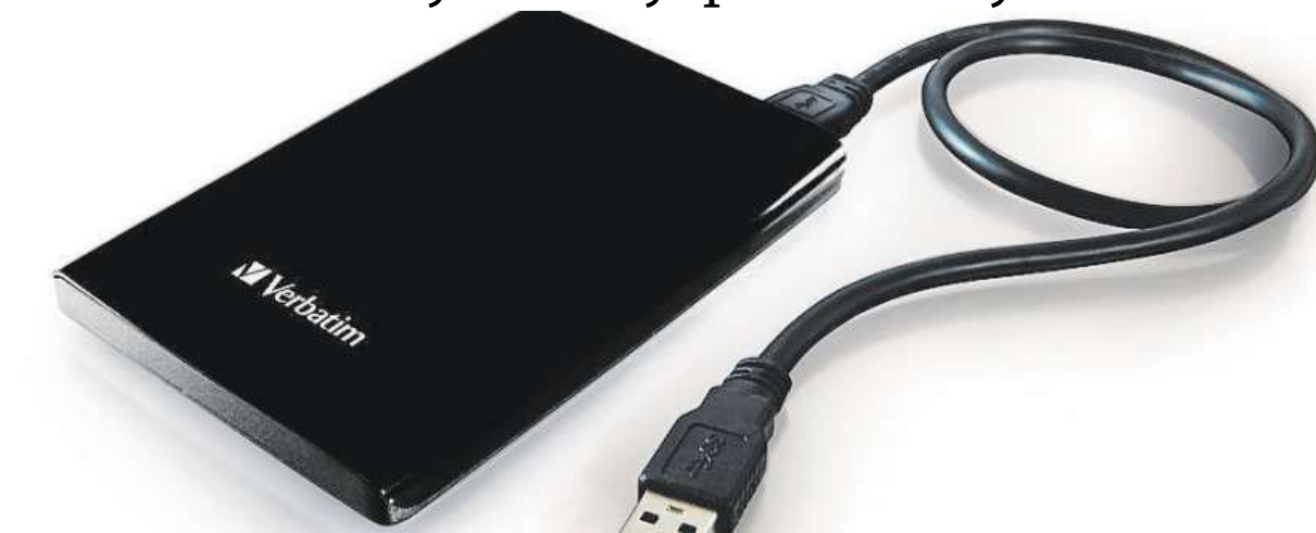
Verbatim Store'n'Go: přenosný disk s bohatou kapacitou

Tím ale výhody disku zdaleka nekončí. Připojit ho může-