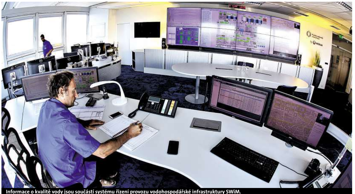
Informace o kvalitě vody jsou součástí systému řízení provozu vodohospodářské infrastruktury SWiM.

ném množství případů byly překročeny limity dusičnanů (limit 50 mg/l) a někdy také limity pro hodnotu zákalu nebo železa, případně dalších ukazatelů (pH, pachu, konduktivity a chloridů). „Tak se nebojte a přijďte k nám do laboratoře. My vám poradíme, jak zlepšit kvalitu vody,“ vyzývá Vavrušková.