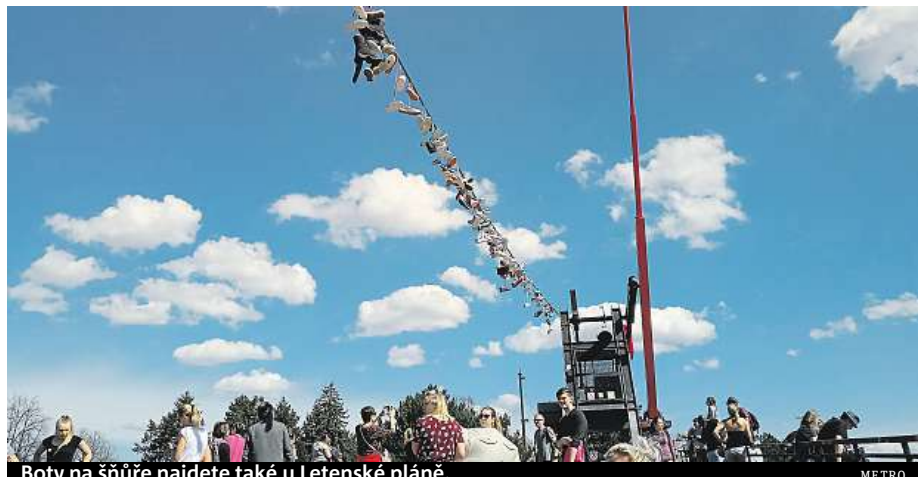
Boty na šňůře najdete také u Letenské pláně.