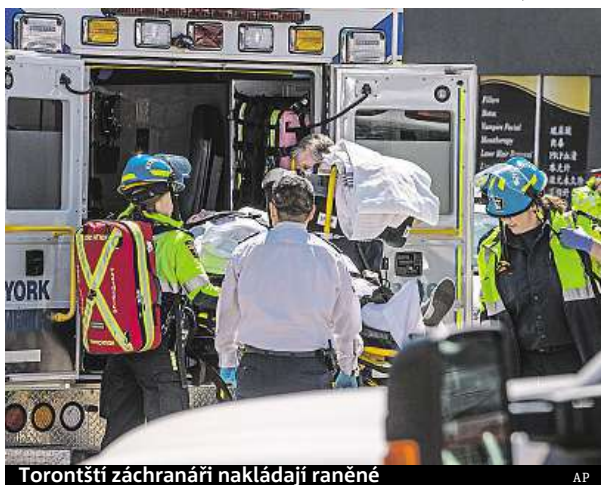
Torontští záchranáři nakládají raněné

„Moje kamarádka byla pryč. Nemohla jsem ji najít. Všude kolem byla těla,“ po-