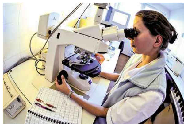
V laboratořích se stanovuje více než 100 parametrů kvality vody.