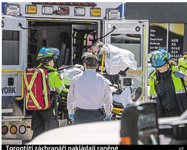
Torontští záchranáři nakládají raněného

„Moje kamarádka byla pryč. Nemohla jsem ji najít. Všude kolem byla těla,“ po-