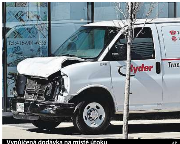
Vypůjčená dodávka na místě útoku