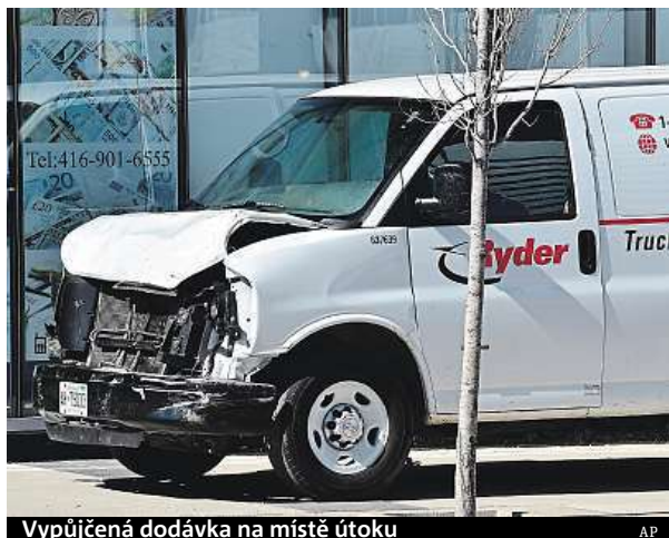
Vypůjčená dodávka na místě útoku