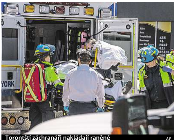
Torontští záchranáři nakládají raněného

„Moje kamarádka byla pryč. Nemohla jsem ji najít. Všude kolem byla těla,“ po-