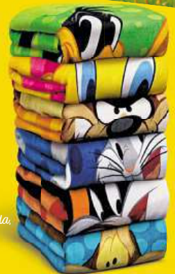
Plážová osuška Kačer Dufly, Kojot Wilda, Jary Bugs Bunny, Tweety, Dylvesten

NASBÍREJ CELOU VÝBAVU LOONEY TUNES A UŽIJ SI PARÁDNÍ PRÁZDNINY.