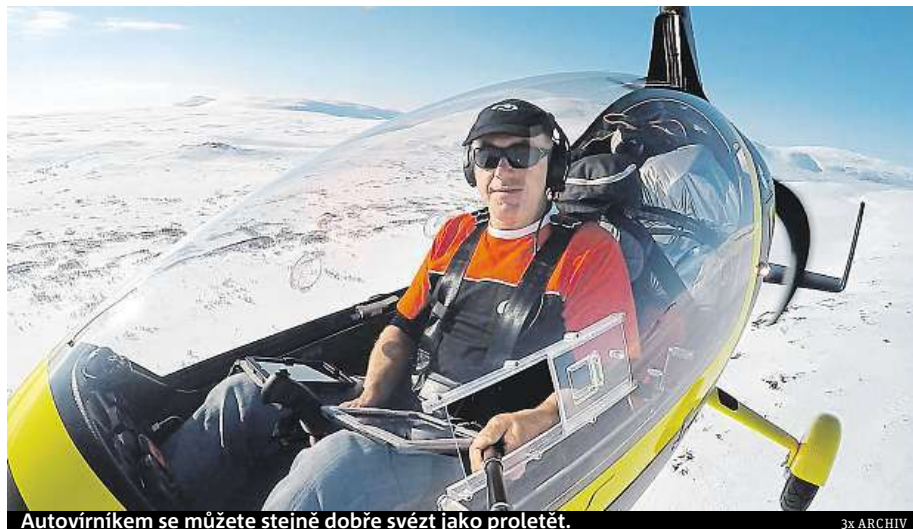
Autovířníkem se můžete stejně dobře svést jako proletět.