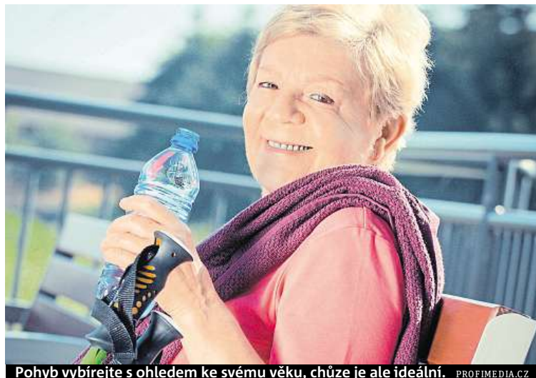
Pohyb vyberte s ohledem ke svému věku, chůze je ale ideální.

Kloubům nedělají dobře tvrdé nárazy ani rotace. Na co dát pozor?