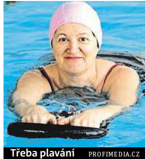
Třeba plavání

„U pasivnějších osob třeba i ztráta pravidelných aktivit, jako je například každodenní chůze na autobus, může znamenat rychlé zhoršení kondice. Pak nedochází pouze ke změnám v pohybovém aparátu, ale také k nabývání na váze,“ varuje lékařka Zbránková. Pokud tedy patříte mezi ty, kteří pohyb mnohem nedají, zkuste to změnit. Uleví se vám nejen na těle, ale i na duši. Nejde o to trhat rekordy a začít hned běhat ki-