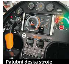
Palubní deska stroje

GyroMotion má vše, co předepisuje vyhláška pro zvolený segment dopravy, tedy blikáče, zpětná zrcátka, odrazky a klakson na celodenní svícení. Do budoucna chce tvůrčí tým kolem Březiny dodat