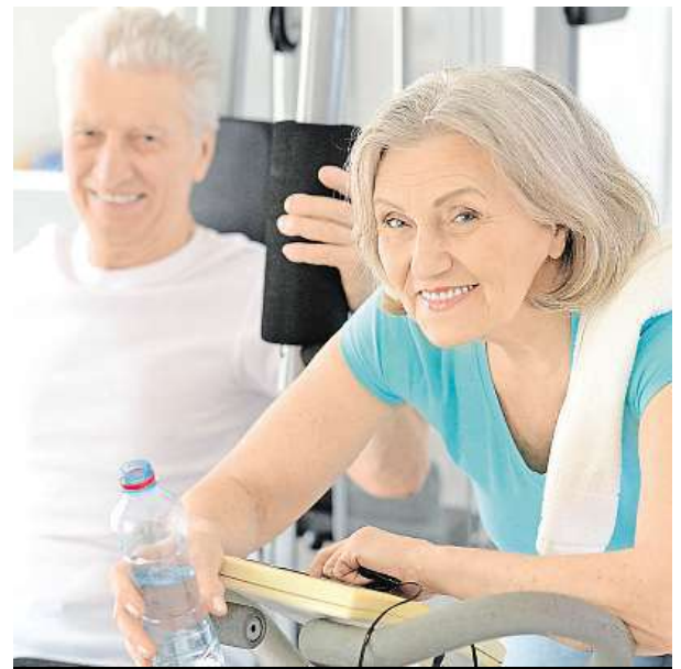
Také v pokročilém věku je třeba se hýbat.

Vždy je třeba pamatovat, že na začátku je potřeba zvolit jednodušší či kratší cvičení. Zátěž je možné navyšovat