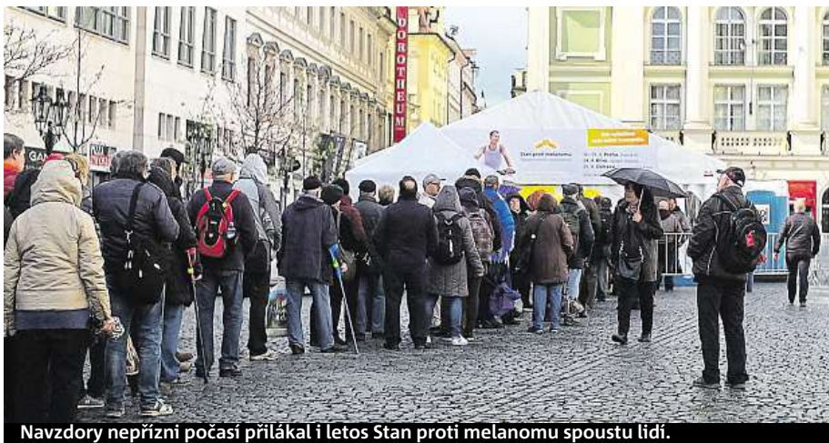
Navzdory nepříznivému počasí přilákal i letos Stan proti melanomu spoustu lidí.

Lékaři se shodují v tom, že zejména nadměrné opalování je jedním z faktorů, které dokonce významně zvyšují ri-