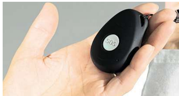
Vaše bezpečí v dlani jedné ruky

Na složitou manipulaci s chytrými telefony klidně zapomeňte. 24h Monitorovací centrum bdí nad svými uživateli nepřetržitě, čímž zajišťuje pomoc opravdu kdykoli. SOS Přívěsek je vybaven SIM kartou, což umožňuje snadnou komunikaci s uživateli přímo přes SOS Přívěsek. Je navíc připraven i na tak ošemetné terény, jako je koupelna. Je totiž vodotěsný. Díky