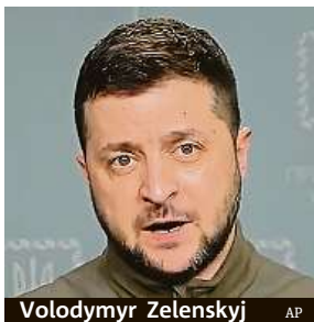
Volodymyr Zelenskyj

Vyhlášení bezletové zóny či jiné přímé zapojení do války proti Rusku ale kvůli hrozbě rozšíření mimo ukrajinské území podle šéfa Aliance Jense Stoltenberga spojenci nechystají.