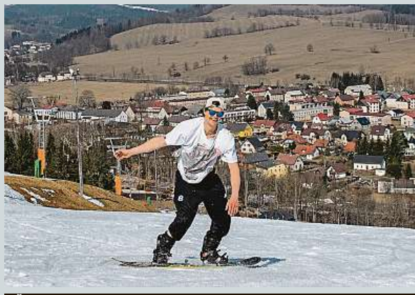
Češi si užívají jaro různě. Některé ještě na horách jezdí, jiní se líbají v parcích. 2x ČTK