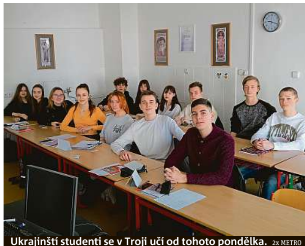
Ukrajínští studenti se v Troji učí od tohoto pondělka. 2x METRO