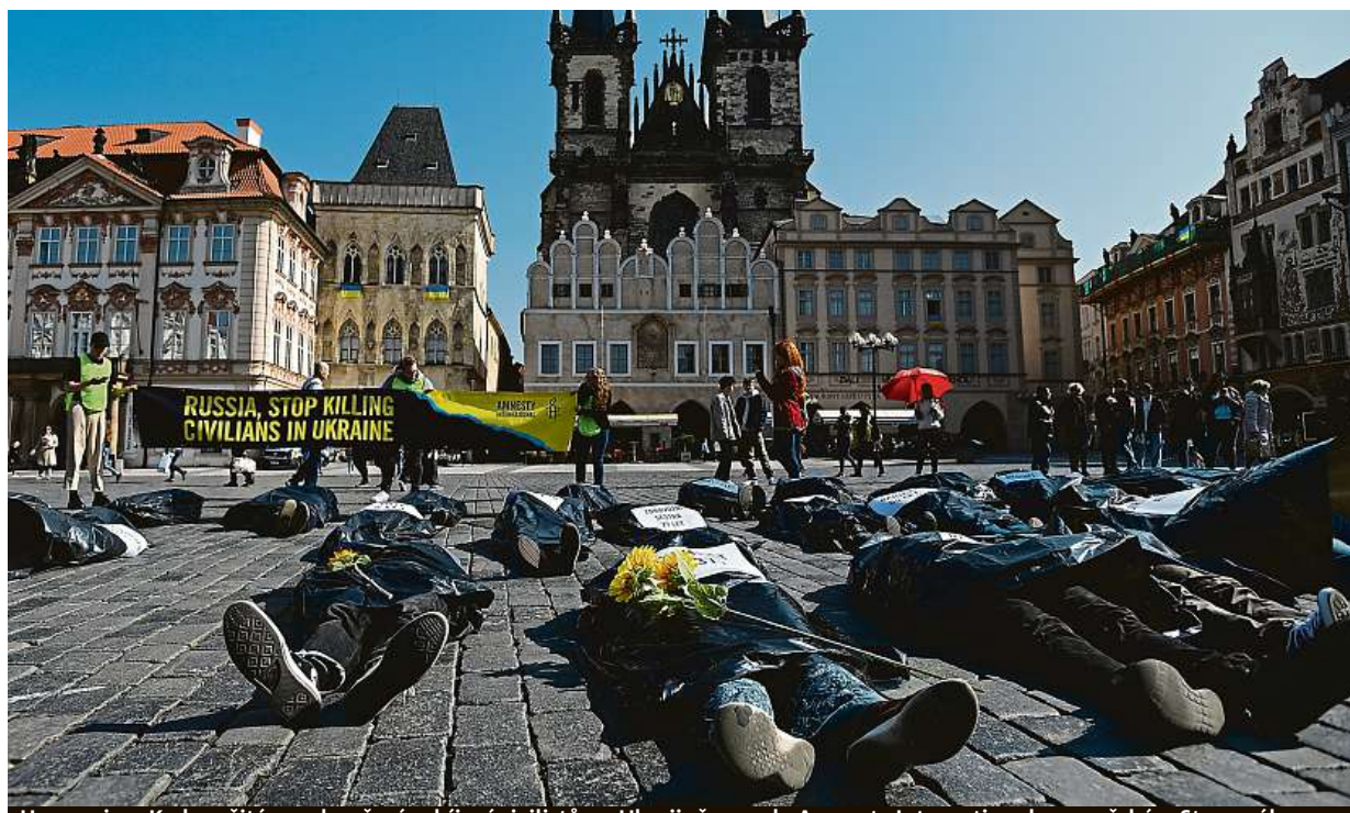
Happening. K okamžitému ukončení zabíjení civilistů na Ukrajině vyzvala Amnesty International na pražském Staromáku.

Trojské gymnázium. V jedné třídě učíme 14 dětí uprchlých z Ukrajiny ve věku od 14 do 17 let, říká ředitel Jendřejas. Perspektiva. Mohou to dotáhnout k maturitě. Začlenění. Důležitý je i jazyk VÍCE NA STRANÁCH VÁLKA NA UKRAJINĚ