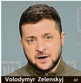
Volodymyr Zelenskyj

Vyhlášení bezletové zóny či jiné přímé zapojení do války proti Rusku ale kvůli hrozbě rozšíření mimo ukrajinské území podle šéfa Aliance Jense Stoltenberga spojenci nechystají.