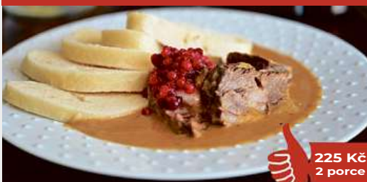
Hovězí svíčková na smětaně, karlovarský knedlík