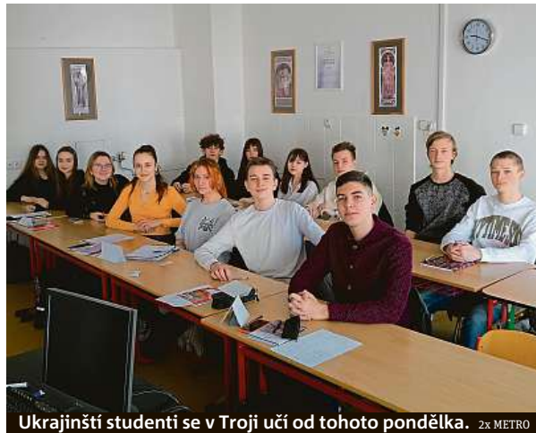
Ukrajínští studenti se v Troji učí od tohoto pondělka.