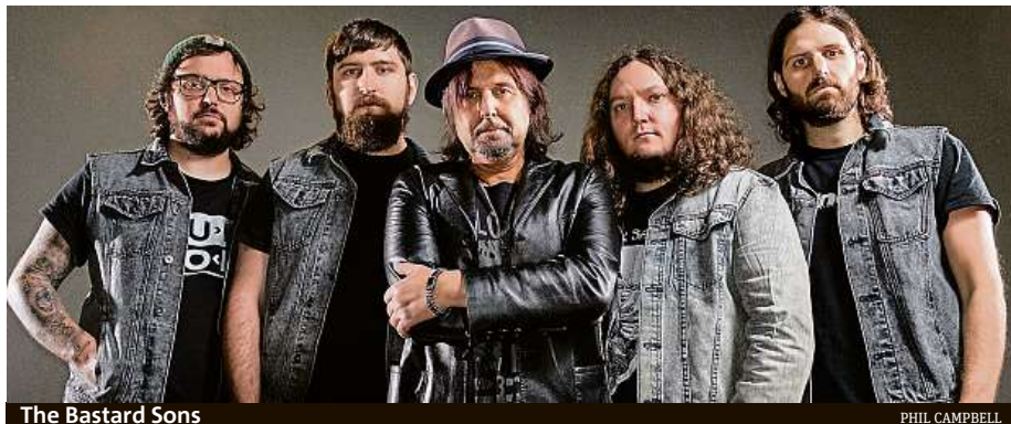
The Bastard Sons

Rozhodnutí znamená, že nebude přeladěna ani přechodová DVB-T2 síť 12 z kanálu 31 na kanál 38. Už tak nebylo vypnuto vysílání programů České televize na DVB-T vysílačích České Budějovice Klef a Vimperk Mařský vrch, plánované na 19. března, a na vysílačích na jižní Moravě, Brno Kojál, Hády, Barvičova a Mikulov Děvín, které mělo zahájit přechod na DVB-T2 na Moravě 31. března. Vypnuto nebude ani vysílání multiplexu 2 v pondělí 23. března v Ústí nad Labem, vysílač Buková hora, a v Chomutově na Jedláku. Platformu pozemního vysílání využívá pro příjem televize v ČR 60 procent domácností. Pozemní televizní vysílání pokrývá svým signálem více než 99 procent domácností v ČR a pozemní televize je pro diváky jedinou bezplatnou platformou. ČTK