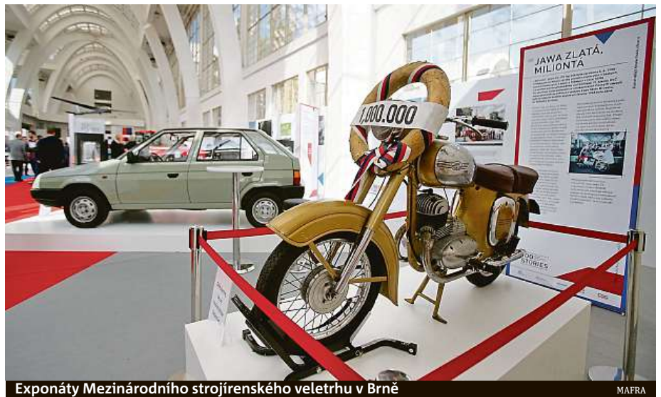
Exponáty Mezinárodního strojírenského veletrhu v Brně

„Musíme si pomoci sami. Navrhovaná opatření jako půjčky či oddálení placení daní jsou jen pro ty, kteří mají špatné cash-flow a nemají rezervy. Žádáme větší flexi-