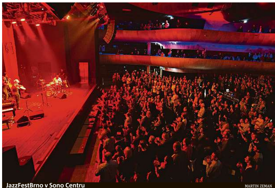
JazzFestBrno v Sono Centru

každou cenu hnát do rizika. I tak během dvou dnů od vyhlášení prvních omezení po vyhlášení stavu nouze návštěvnost výrazně klesla. Návštěvníci totiž více méně nerozlišují státní, krajské, městské a soukromé památky, takže by možná nepřišli tak jako tak,“ říká produkční Letohrádku Mítrovských Petr Lukas. Provozovatelé tohoto výstavního prostoru platí nájemné městu a zápůjčné výstavy. Zda vyjednájí nějakou slevu, nebylo v době uzávěrky jisté. V nenáhradnu ale zřejmě zmizí peníze investované do nyní už zbytečné reklamy. V obdobné situaci jsou však víceméně i všechny další kulturní instituce. Důležité tak bude, jak brzy se situace zlepší a jak si kdo povede při vyjednávání kompenzací, půjček, slev či jiných úlev, náhradních termínů a dalších cest, jak se postavit znovu na nohy. V ještě složitější situaci se však ocitají soukromníci pracující v kulturním sektoru – počínaje samotnými umělci a konče technickými profesemi, jako jsou zvukaři či osvětlovači. Někteří z nich už na situaci rychle reagovali dočasnou změnou povolání.