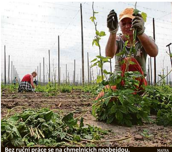
Bez ruční práce se na chmelnicích neobejdou.