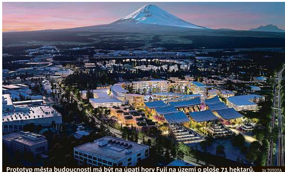
Prototyp města budoucnosti má být na úpatí hory Fuji na území o ploše 71 hektarů.

Město je navrženo jako plně udržitelné s budovami převážně ze dřeva kvůli minimálním dopadům na životní prostředí s využitím tradičních japonských truhlářských postupů v kombinaci s automatizovanými výrobními technologiemi. Střechy