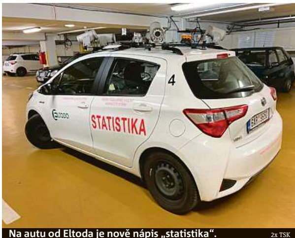
Na autu od Eltoda je nově nápis „statistika“.

„Slouží nám k monitoringu situace tak, aby bylo možné reagovat, ulehčit dopravě a umožnit parkování, především zdravotníkům, pečovatelným i nemocným. V této době se jedná o prostý sběr dat, v žádném případě nejde o špatné parkování, a následné pokutování. To ovšem neznamená, že neplatí ostatní