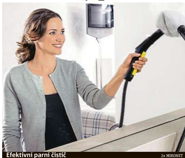
Efektivní parní čistěč

A že takto důkladné čištění musí vyjít draze? Ba naopak. Parní čistěč Kärcher SC 2 EasyFix pořídíte v internetovém obchodě Mironet za pouhých 2699 korun. Zboží si pak můžete standardně osobně vyzvednout na všech pobočkách Mironetu po celém Česku nebo si jej nechat poslat až domů s možností bezkon-