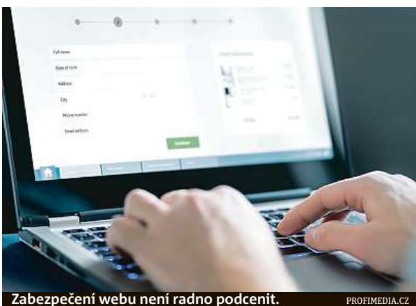
Zabezpečení webu není radno podcenit.

Nejúčinněji chráněné weby mezi veřejnými institucemi mají podle analýzy projektu Česko v datech vysoké školy. Alespoň základní protokol HTTPS pro šifrovanou komunikaci využívá 76 procent z nich. I přesto se e-mailové adresy studentů i lektorů často stávají oběťmi phishingu. Ten z uživatelů vymáhá přístupové údaje podvodným e-mailem vyžadujícím kliknutí na odkaz a změnu hesla. „Zabezpečené weby převažu-