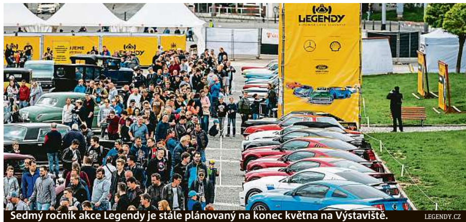
Sedmý ročník akce Legendy je stále plánovaný na konec května na Výstaviště. LEGENDY.CZ

„Pevně věřím, že Legendy se letos v daném termínu uskuteční a náš realizační tým tak bude mít možnost velkému počtu našich záchrannářů upřímně poděkovat,“ říká Kos. Na konci dubna bude rozhodnuto, zda výstava bude pořádána v řádném termínu na konci května, nebo se její realizace s ohledem na vývoj situace termínově posune. HOP