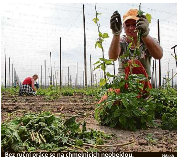
Bez ruční práce se na chmelnicích neobejdou.