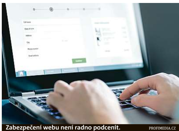
Zabezpečení webu není radno podcenit.

Nejúčinněji chráněné weby mezi veřejnými institucemi mají podle analýzy projektu Česko v datech vysoké školy. Alespoň základní protokol HTTPS pro šifrovanou komunikaci využívá 76 procent z nich. I přesto se e-mailové adresy studentů i lektorů často stávají obětmi phishingu. Ten z uživatelů vymáhá přístupové údaje podvodným e-mailem vyžadujícím kliknutí na odkaz a změnu hesla. „Zabezpečené weby převažu-