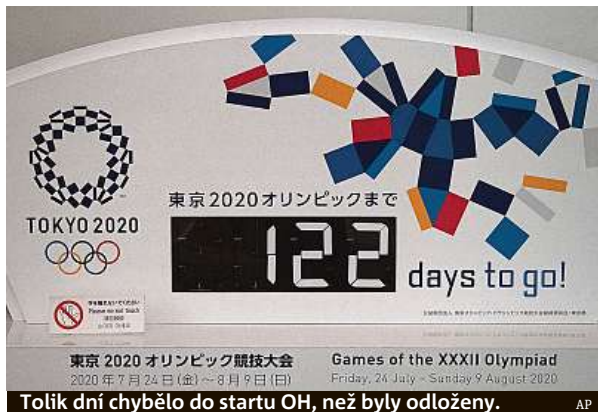
Tolik dní chybělo do startu OH, než byly odloženy.

Organizátoři i představitelé MOV dlouho ubezpečovali, že se hry uskuteční v naplánovaném termínu. V minulých dnech ale obě strany připustily, že začínají o odkladu uvažovat. Bach v neděli oznámil, že rozhodnutí by mělo padnout do čtyř týdnů, nakonec k tomu MOV sáhl dříve. Nový termín konání OH zatím nebyl určen. „Teď vám nemůžu dát konečnou odpověď. Otá-