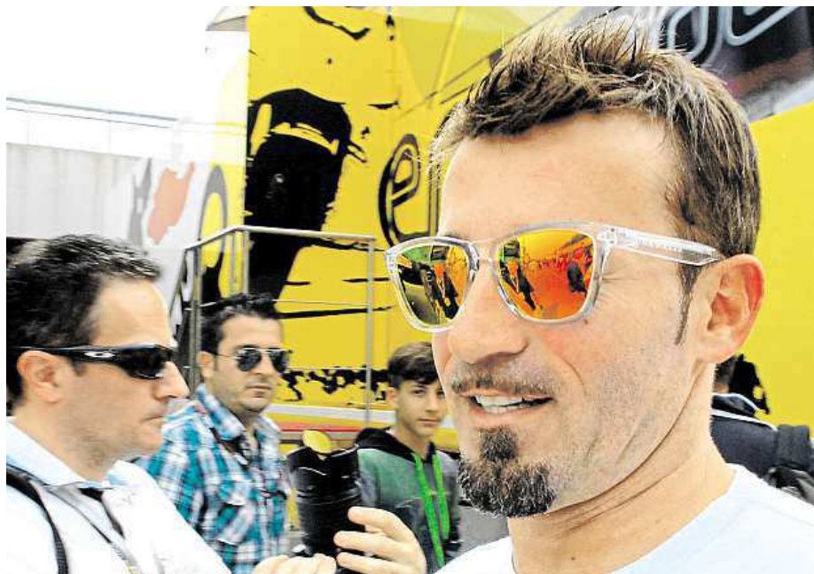
Dva ze sedminásobných brněnských vítězů: Max Biaggi...