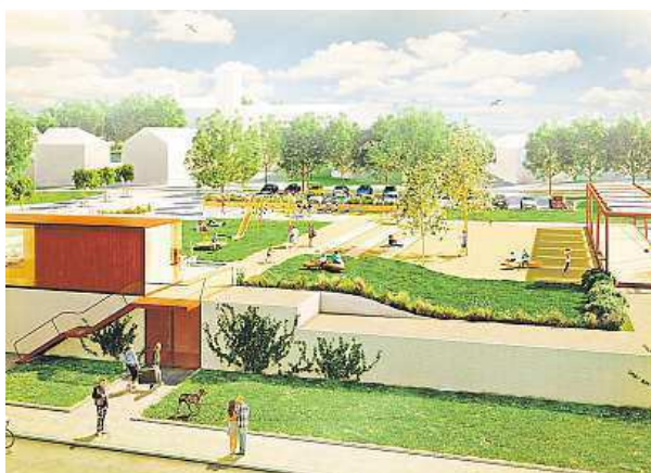
Vizualizace obou variant z jiného úhlu, vlevo varianta 1, vpravo varianta dvě i s bazénkem v dálce