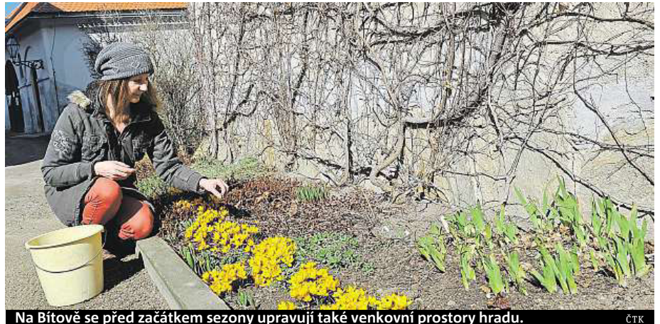
Na Bítově se před začátkem sezony upravují také venkovní prostory hradu.