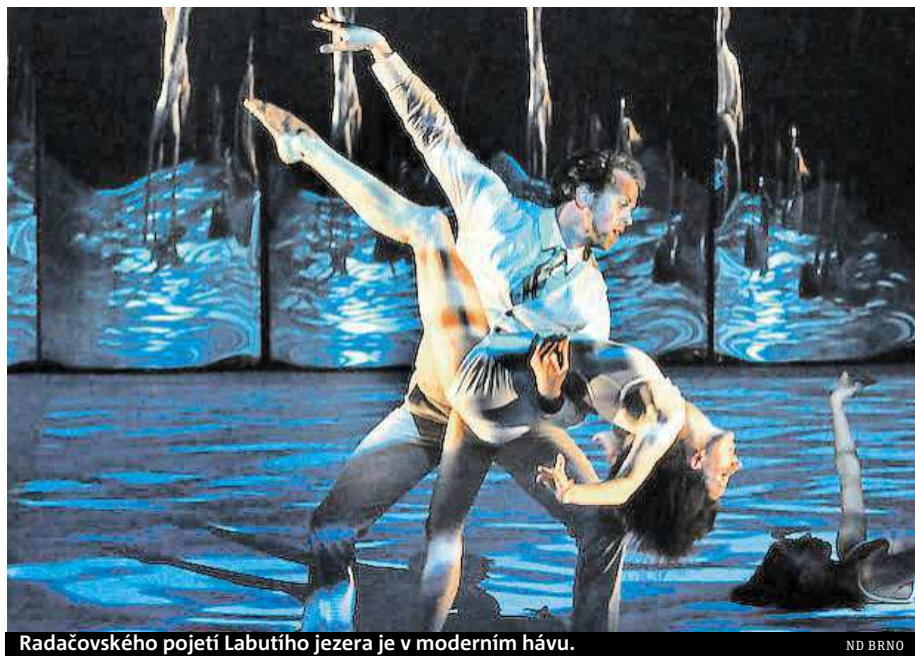
Radačovského pojetí Labutího jezera je v moderním hávu.