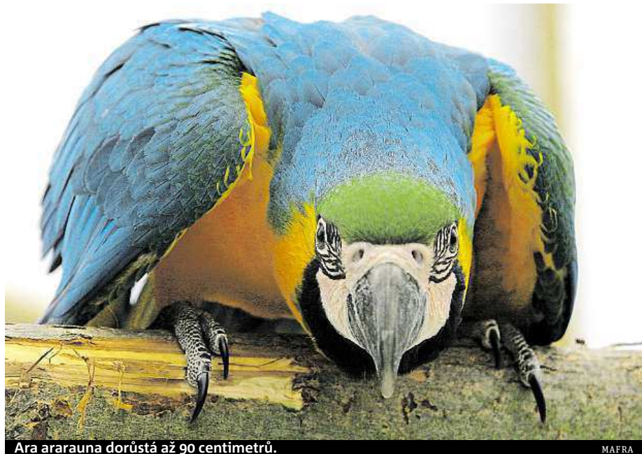
Ara ararauna dorůstá až 90 centimetrů.

Vedení zoo zve na návštěvy i děti z mateřských a základních škol, pro které je připraven speciální dětský výklad. „Jedním z nejoblíbenějších zážitků jsou pro ně papoušci z domácích odchovů. Ti jsou totiž nejvíce ohočení,“ vysvětlila Škrháková. Někteří se už naučili deset i více slov. BARBORA ČAPKOVÁ