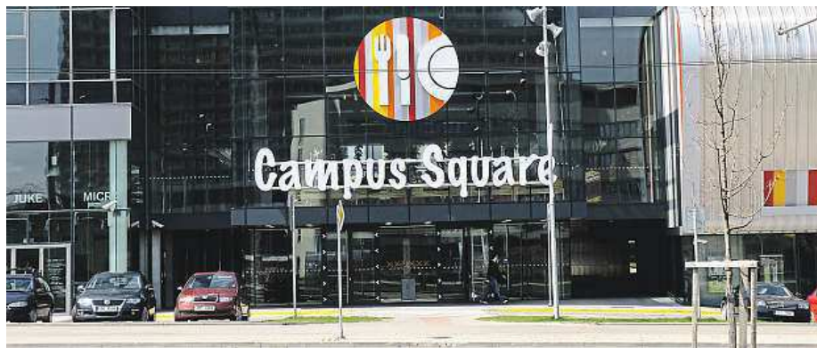
Brněnské obchodní centrum Campus Square je otevřené od roku 2008.