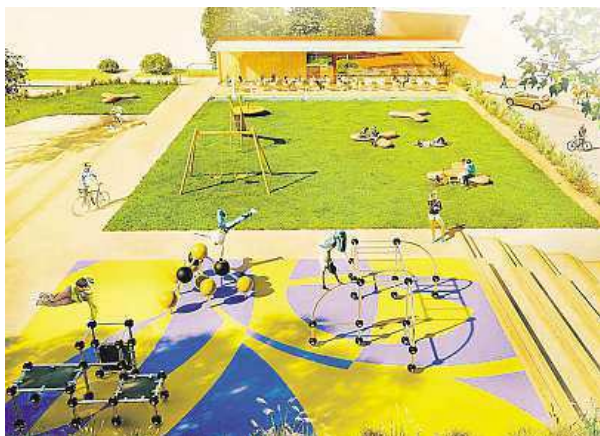
Vlevo vizualizace 1 bez bazénku, vpravo vizualizace 2 s ním