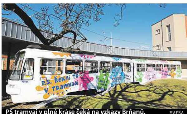
PS tramvaj v plné kráse čeká na vzkazy Brňanů.

„Dnešní doba nahrává spíše moderním komunikačním technologiím, navzájem