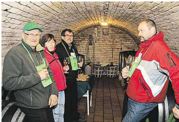
Takto to vypadalo na akci Ze sklepa do sklepa v roce 2014.

Putování za víny po Velkých Bílovicích dokreslí neopakovatelná atmosféra největší vinařské obce u nás a tóny tradiční cimbálové muziky. Kdo si tento moravský vinařský Oktoberfest nechce nechat ujít, musí sáhnout