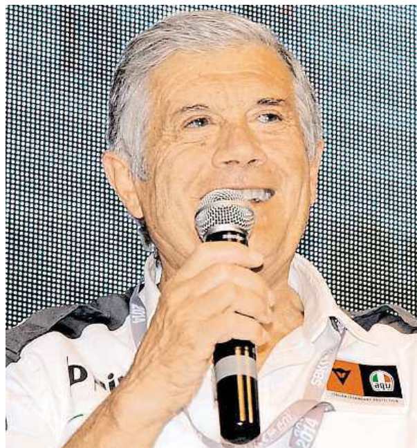
...a Giacomo Agostini