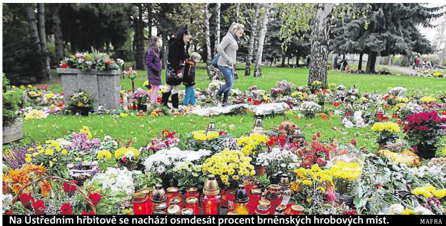
Na Ústředním hřbitově se nachází osmdesát procent brněnských hrobových míst. MAPRA

Městská část Brno-Líšeň by se rozšíření hřbitova mohla dočkat už letos.