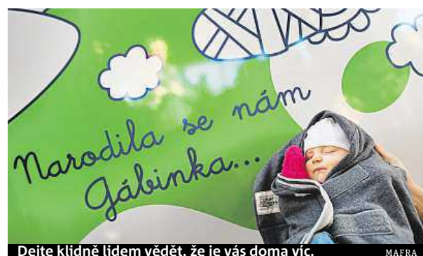
Dejte klidně lidem vědět, že je vás doma víc.

Zájemci o umístění vzkazu do PS tramvaje mohou nosit svoje textové či obrázkové plakáty o rozměru A4 do Informační kanceláře DPMB na Novobranské ulici. Vzkazy ne-