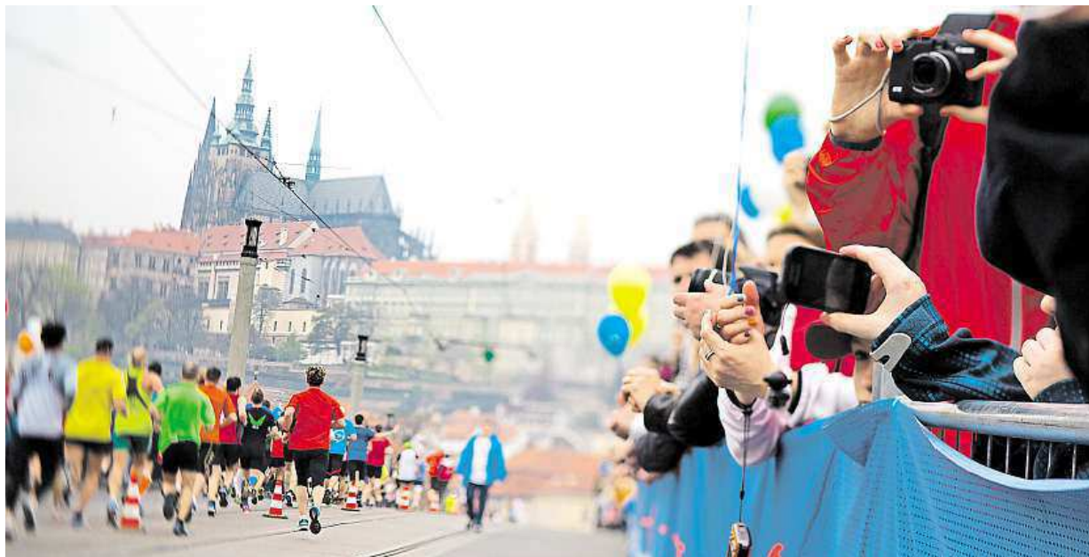
Takhle vypadal závod loni. I letos budou v ulicích tisíce běžců a diváků.