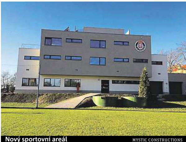
Nový sportovní areál

Rekonstrukce staré klubovny s dílnou pro údržbu areálu, která trvala téměř celý minulý rok, udělá podle mluvčí radost nejvíce malým fotbalistům. „Nové zázemí uvítají