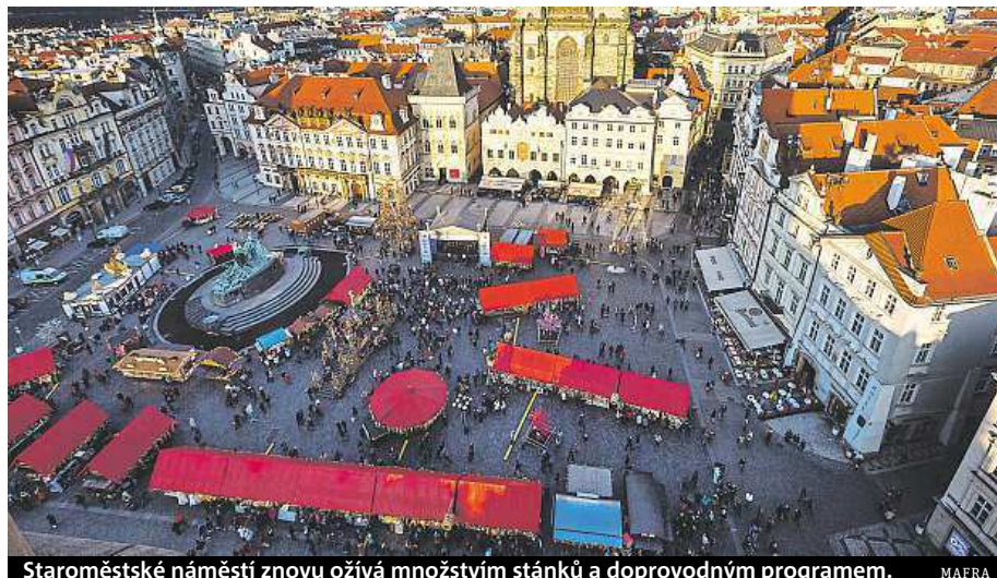
Staroměstské náměstí znovu ožívá množstvím stánků a doprovodným programem.

Největší pražské velikonoční trhy se už po jedenácté konají na Staroměstském a Václavském náměstí v centru města.