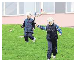
Koledníci v Praze