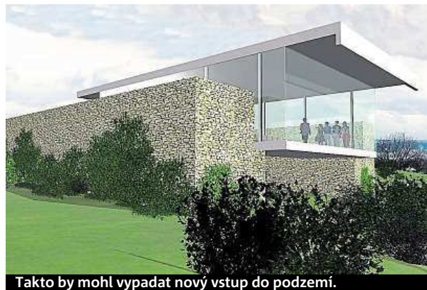
Takto by mohl vypadat nový vstup do podzemí.