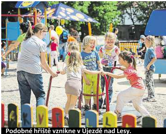
Podobné hřiště vznikne v Újezdě nad Lesy.

Jednou z podmínek je, aby hřiště vzniklo do půl kilometru od prodejen Lidl, neboť tato společnost projekt zastrešuje a platí. Hodnota takového hřiště je 1,5 milionu korun. Podle radní Újezdu Šárky