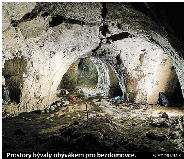
Prostory bývaly obývkem pro bezdomovce.