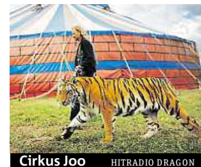
Cirkus Joo HITRADIO DRAGON

Prosecký park ovládá cirkusová show. V parku Přátelství u stanice metra Střížkov až do pátého dubna hostuje český národní Cirkus Joo. Návštěvníci zhlédnou představení inspirované filmem Madagaskar, komický, artistický i drezérský program, ve kterém se představí smečka sibiřských tygrů, pumy americké, opice z čeledi makak, papoušci ara i velké kolekce plazů. Dech se divákům zatají také při akrobacii na visutých šálách či akrobacii. „Přijďte na naše unikátní představení kombinující cirkusová čísla s hraným dějem filmu Madagaskar,“ zve čtenáře deníku Metra ředitel Cirkusu Patrik Joo. FILIP JAROŠEVSKÝ