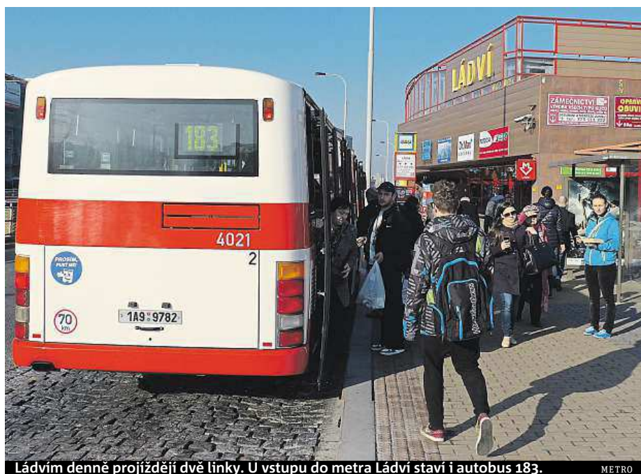
Ládvím denně projíždějí dvě linky. U vstupu do metra Ládví stává i autobus 183.