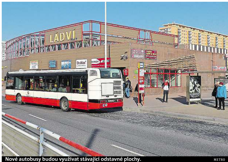
Nové autobusy budou využívat stávající odstavňé plochy.