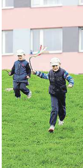
Koledníci v Praze