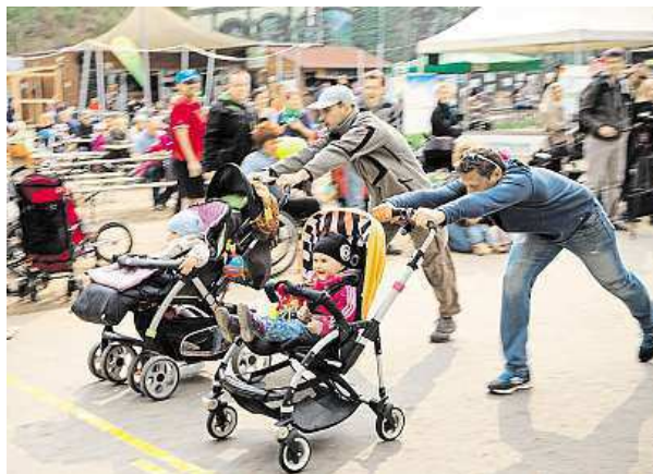
S kočárky závodí také tatínkové. METRO