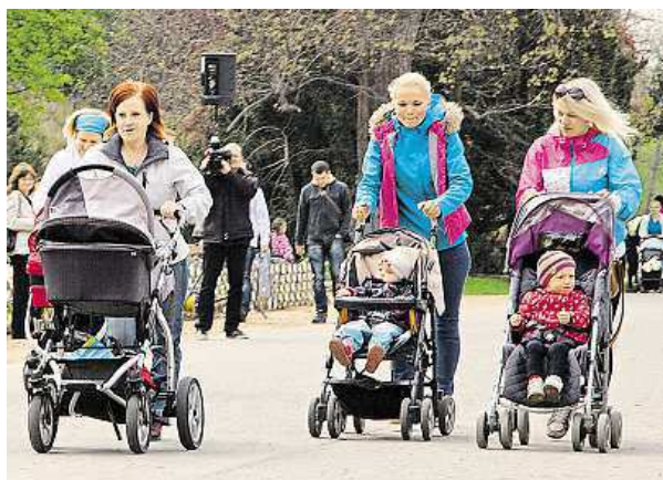
Některé maminky závod pojmají vyloženě rekreačně. METRO