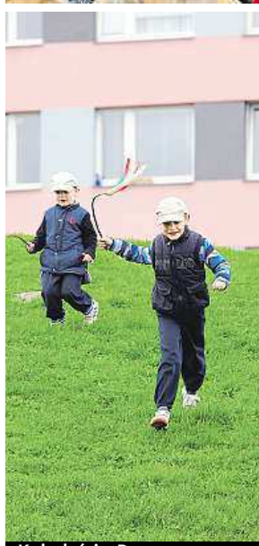
Koledníci v Praze