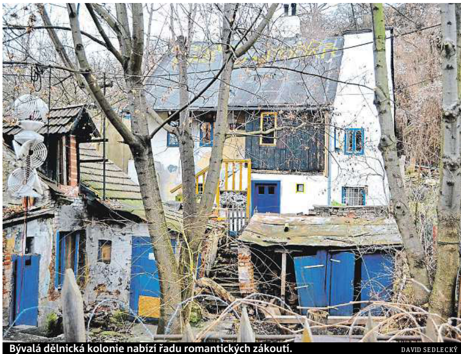
Bývalá dělnická kolonie nabízí řadu romantických zákoutí.

Po úklidu nechá radnice zajistit a zakonzervovat jednotlivé domy před jejich budoucí rekonstrukcí. Náklady na vyklízení jsou zhruba 1,2 mi-