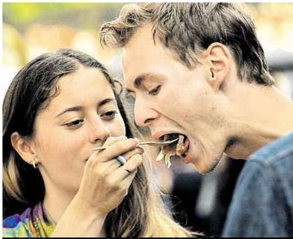
Náplavka Street Food – také na Smíchově