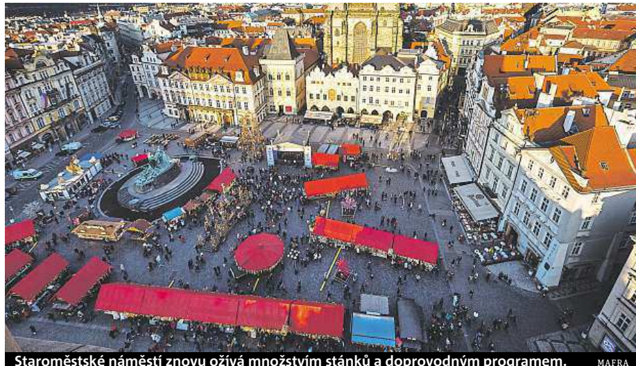
Staroměstské náměstí znovu ožívá množstvím stánků a doprovodným programem.

Ryze velikonoční sortiment nabízí trhy na náměstí Míru, které trvají až do 6. dubna. Návštěvníci se můžou těšit také na bohaté občerstvení včetně uzenářských a sýrových dobrot či makedonských delikates.