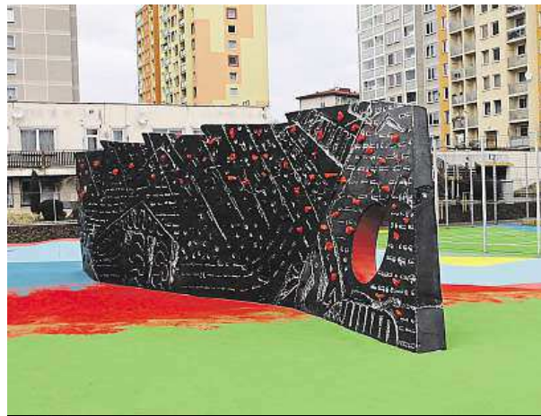
Hřiště nabídne i bouldering.