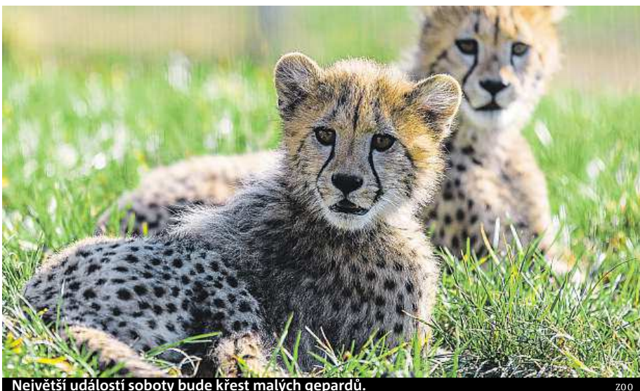
Největší událostí soboty bude křest malých gepardů.

„Kromě gepardů se návštěvníci mohou těšit také na mod-