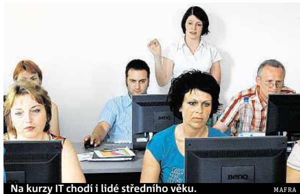
Na kurzy IT chodí i lidé středního věku.

Například ze statistiky úřadů práce mimo jiné vyplývá, že v Česku uchazeči o zaměstnání nejčastěji vyhledávají