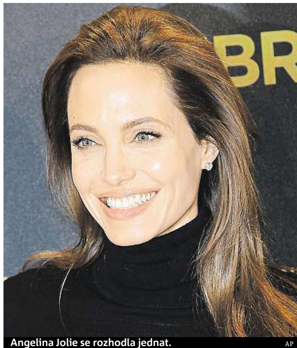
Angelina Jolie se rozhodla jednat.

Jolie v článku pro deník The New York Times vyzvala ženy, aby o sebe pečovaly a radily se s lékaři. Po zákroku se dobrovolně dostala do menopauzy a nemůže mít už další děti. „Každý zdravotní problém má více řešení. Nejdůležitější je se informovat o možnostech řešení s lékaři a vybrat si to, které je pro vás osobně správné,“ zdůraznila Jolie. Podle výsledků testů měla prý pravděpodobnost až 87 procent, že ji může postihnout nádor prsu, a 50 procent, že karcinom může zasáhnout vejcovody a vaječnický. Patří do rizikové skupiny, na rakovinu vaječnicků zemřela její matka v 49 letech. Na rakovinová onemocnění navíc zemřely i její babička a teta.