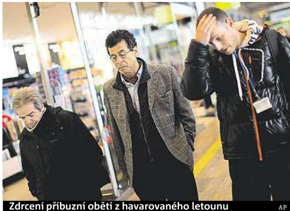
Zdrzení příbuzní obětí z havarovaného letounu