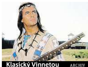
Klasický Vinnetou ARCHIV