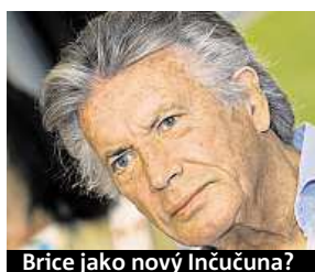
Brice jako nový Inčučuna?

lenkou hrát Vinnetouova otce nadšen,“ řekl však 86letý herec deníku Bild.