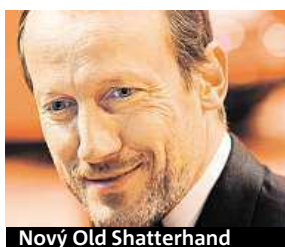
Nový Old Shatterhand