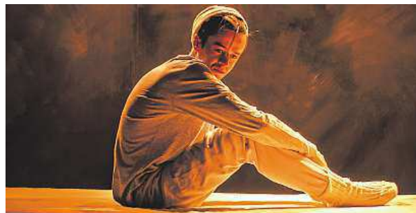
Každý z herců hraje hned několik rolí.