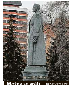
Možná se vrátí.

Hlasování vzniklo na popud otevřeného dopisu, jehož iniciátorem je Zachar Prilepin, postava bývalé extremistické Národně-bolševické strany. Signatáři tvrdí, že pomník Dzeržinského byl odstraněn roku 1991 nezákonně. Druhou možností při hlasování bude nahrazení sochy památníkem panovníka Alexandra Něvského.