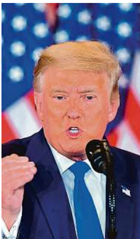
Donald Trump

Republikánskou stranu podle listu The Guardian opusti-