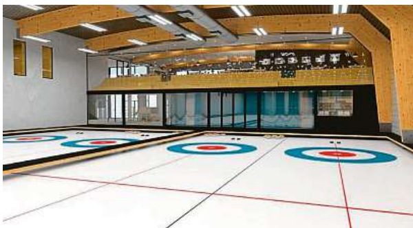
Vizualizace ledové plochy

Staveniště pro realizaci Areálu ledových sportů bylo předáno minulý týden zhotoviteli. Areál vznikne v blízkosti ZŠ Ke Kateřinkám, veřejnosti by se měl otevřít na jaře příštího roku. Projekt výstav-