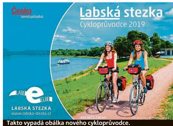
Takto vypadá obálka nového cykloprůvodce.

tit nechat si vyprat oděvy a další,“ řekl Mourek. Cykloprůvodce vychází v nákladu 260 tisíc kusů v české a německé jazykové mutaci a přináší tipy na hlavní atrakce a informace o servisech, přívozech, turistických infocentrech a dalších službách pro cyklisty. Formátem se podle Mourka vejde do každé cyklobrašny.