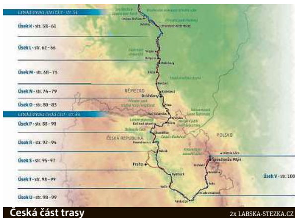
Česká část trasy

Na stavby získal kraj dotace. Právě úsek přes Ústecký