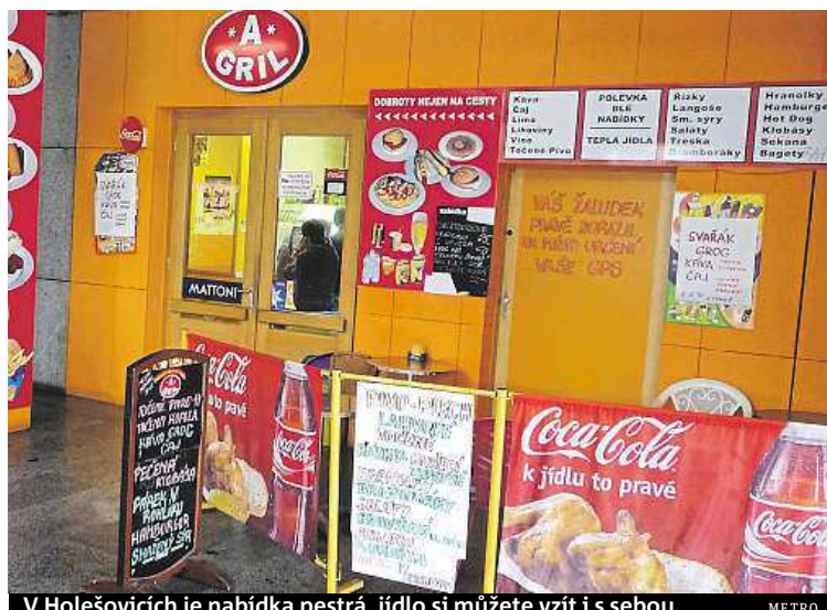
V Holešovicích je nabídka pestrá, jídlo si můžete vzít i s sebou. METRO