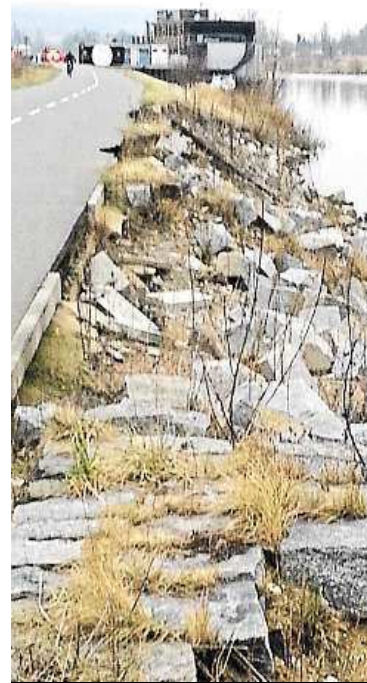
Vltavské břehy METRO

Hlavní město nyní čeká na vydání stavebního povolení pro dlouho připravovanou rekonstrukci Ústřední čističky odpadních vod na Císařském ostrově. Protože se jedná o větší zásah do vodního toku, který způsobí překážku v průtoku, musí město společně s Povodím Vltavy připravit kompenzační opatření tak, aby stav-