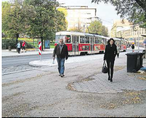
Nedokončený úsek na Čechově náměstí

Nejbližší opravy v okolí Moskevské se budou týkat Ži-