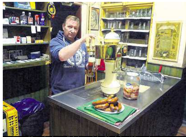
Hospodě na bubenečském nádraží ubývají hosté. METRO

Stejnou cenu desítku mají i na nádraží ve Vysočanech. Zde už pivo čepují, ale jídelní lístek mají o něco menší. Hladový návštěvník dostane na výběr jen mezi tlačenkou,