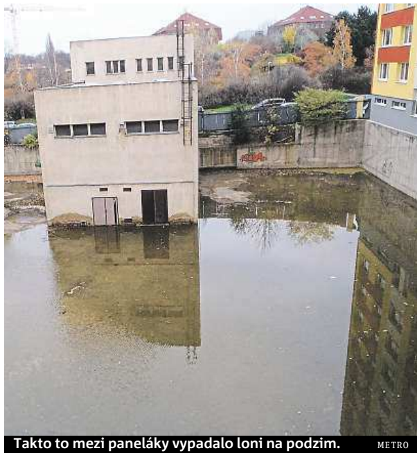
Takto to mezi paneláky vypadalo loni na podzim.