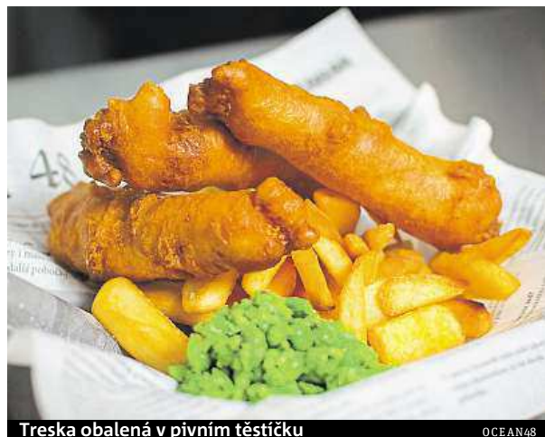
Treska obalená v pivním těstíčku