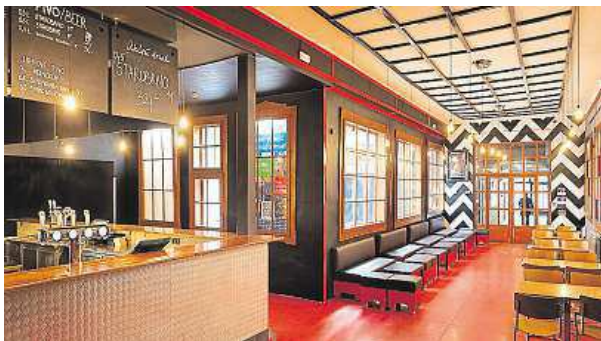
Nový interiér Flédy lahodí oku, sází na osvědčenou kombinaci bílé, červené a černé s doplňky ve dřevě či kůži.

„Při renovaci a přípravě nového designu jsme si vybírali osvědčené architekty a designéry. S modernizací aparatury nám naopak pomohla zpětná vazba a zkušenost vystupujících kapel. Výsledná kombinace příjemného interiéru a perfektního zvuku nás hodně mile překvapila,