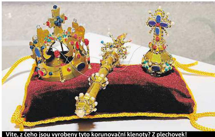
Víte, z čeho jsou vyrobeny tyto korunovační klenoty? Z plechovek!