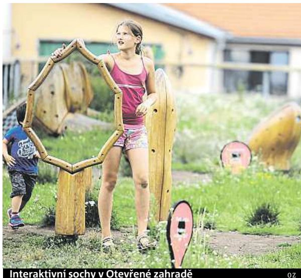
Interaktivní sochy v Otevřené zahradě

Už letos se přichází můžou v Boromejské zahradě těšit na záplavu rostlin, především na spoustu bylinek pěstovaných bez jakýchkoliv chemických hnojiv. Otevřená zahrada využije tento prostor pro pořádání bylinkových dílen pro veřejnost. Slavnostní otevření Boromejské zahrady se plánuje na 13. června.