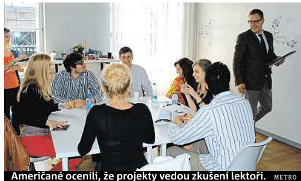
Američané ocenili, že projekty vedou zkušení lektori. METRO

Zástupci amerických univerzit ocenili především zaměření Uniferu na praxi a řešení reálných projektů pod vedením zkušených lektorů. Spojené státy v této oblasti nemají podle Gálíka žádný výrazný náskok a podobné projekty tam vznikají teprve v posledních letech. „V současné době prochází svět skutečně krizí vzdělávacích systémů. Ukazuje se, že tradiční způsob už neodpovídá potřebám současné společnosti.