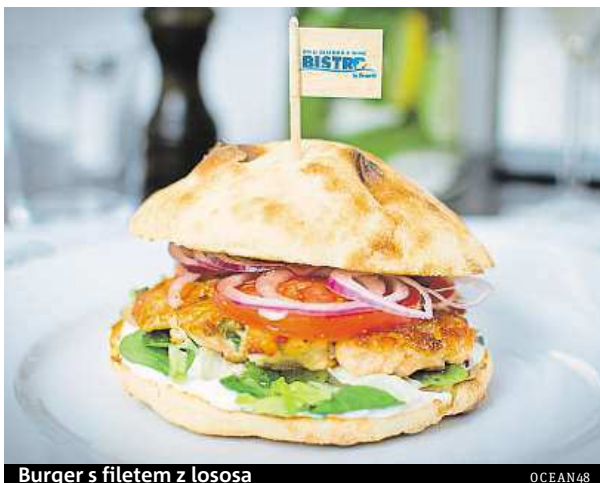
Burger s filetem z lososa