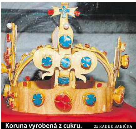
Koruna vyrobená z cukru.

Letohrádek Mitrovských láká návštěvníky na prvotřídní kopie korunovačních klenotů od uznávaného šperkaře Jiřího Urbana. Výstava připomíná blížící se 700. výročí narození Karla IV. Nabízí i mnohé další zajímavosti. Obdivovat tam můžete nejen repliky, ale také dokonalou práci mladých cukrářů ze Střední školy potravinářské na Charbulově. Ti pro výstavu vyrobili co do velikosti i vzhledu velmi kvalitní sladké napodobeniny korunovačních klenotů z žele a cukrářské hmoty. BAB