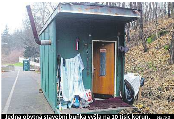
Jedna obytná stavební buňka vyšla na 10 tisíc korun. METRO