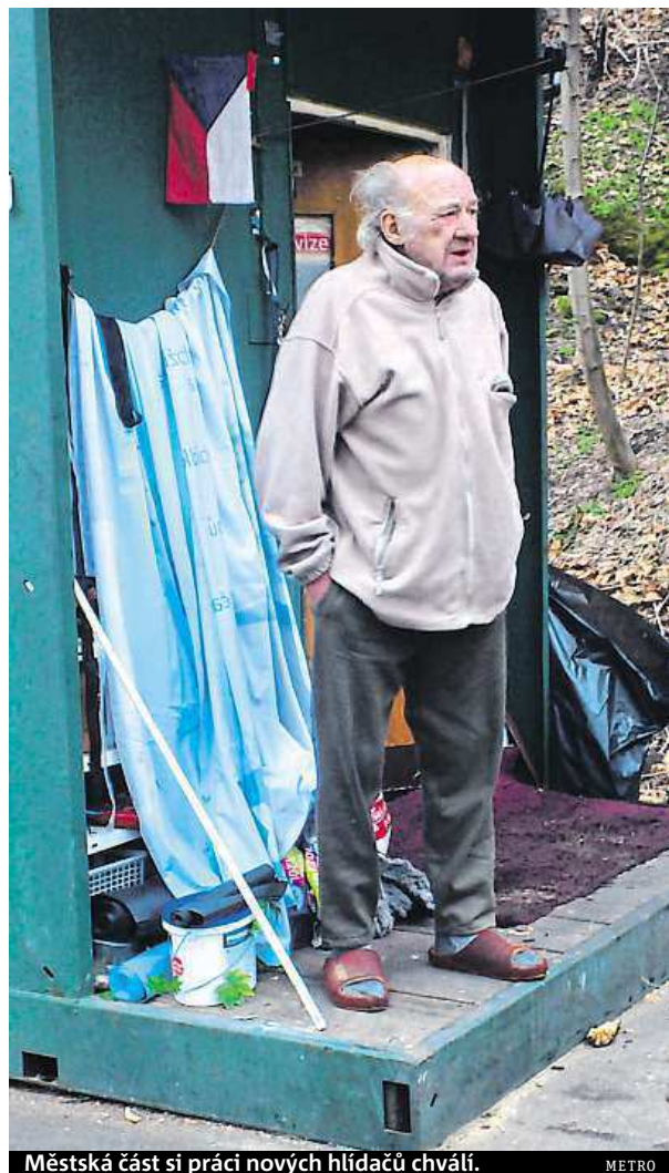
Městská část si práci nových hlídačů chválí. METRO