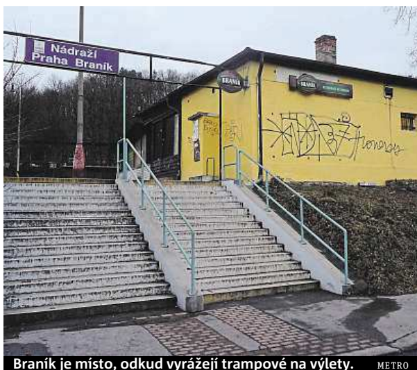
Braník je místo, odkud vyrážejí trampové na výlety. METRO