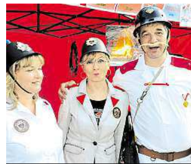
Spolek za veselejší Strážkov