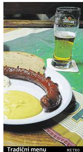
Tradiční menu METRO