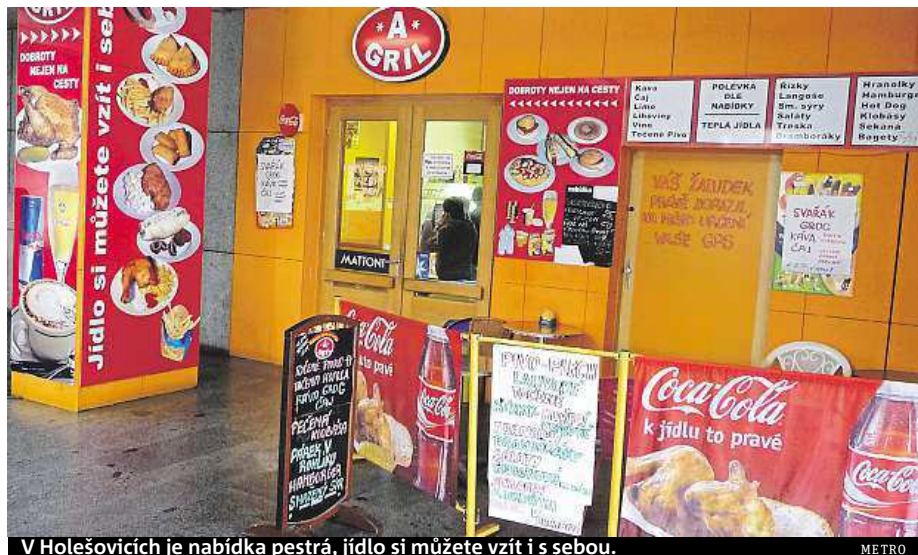
V Holešovicích je nabídka pestrá, jídlo si můžete vzít i s sebou.