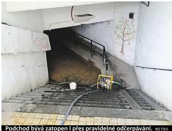
Podchod bývá zatopen i přes pravidelné odčerpávání. METRO

Pokud Klánovičtí překonají nepříjemnou cestu podchodem ve zdraví, čeká je na jeho