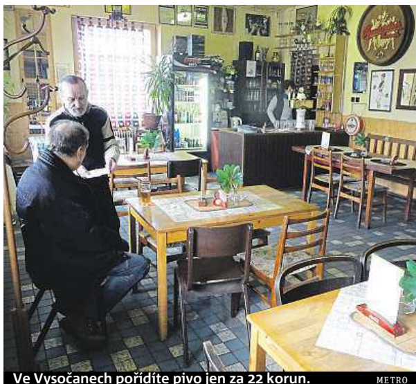
Ve Vysočanech pořídíte pivo jen za 22 korun. METRO