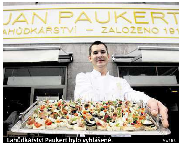
Lahůdkářství Paukert bylo vyhlášené.

Inspektoři našli kromě ořzané izolace také větší množství myšního trusu. „Trus jsme sice našli přímo na potravinách, z logiky věci je však jasné, že k jejich kontaktu a následně kontaminaci potravin dojít mohlo,“ dodal mluvčí.