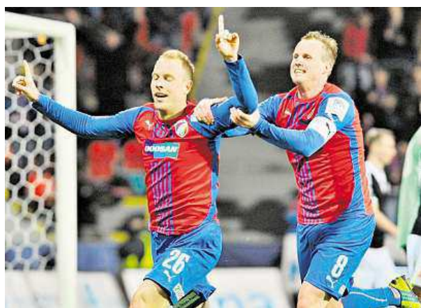
Od příští sezony má být fotbalová liga řízena kluby. ČTK

Třeba Komise rozhodčích však musí podle mezinárodních řádů zůstat pod národní asociací. PAVEL URBAN a IDNES.cz