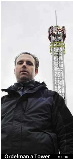
Ordelman a Tower METRO

Kolik bude atrakce stát, zatím neví ani pořadatelé. „Zahraniční velké atrakce stojí i dvě stě korun. To je čistě na provozovateli, kolik si za jízdu řekne, ale občas se sta-