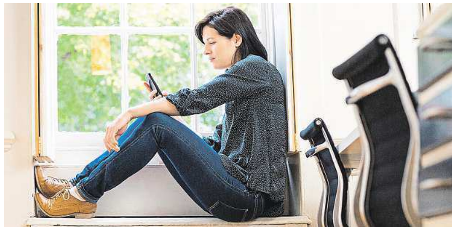
Roste soukromé surfování na firemních chytrých mobilech a tabletech.