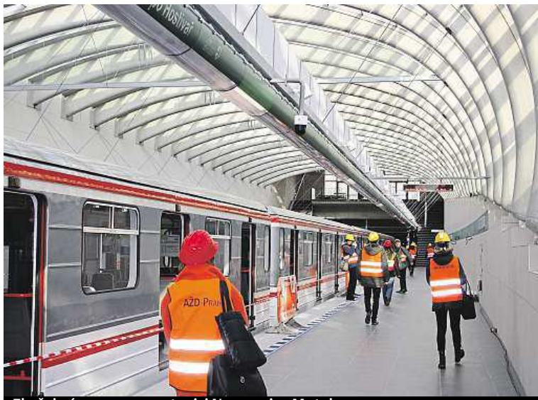
Zkušební souprava ve stanici Nemocnice Motol