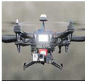
Kdo je řídí?

Nejefektivnější zbraní proti malým létajícím strojům jsou prozatím lovecké brokovnice.