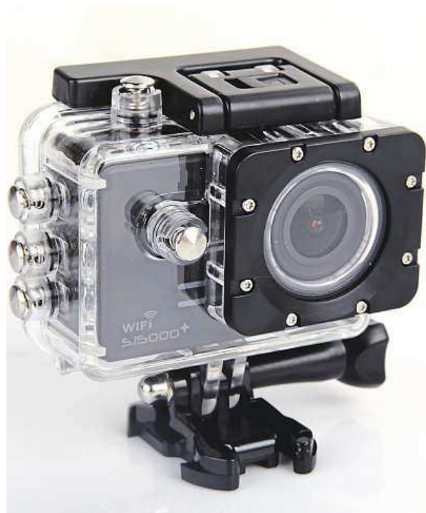
Sjcam SJ5000 je k máni od šesti tisíc.

Pro lepší outdoorové kamery by ale neměl být problém zvládnout full HD i při šedesáti FPS. Tuto zkratku často najdete na webových stránkách e-shopů, označuje totiž mezinárodně používanou zkratku frames per second, což není nic jiného než počet snímků za vteřinu. Snadno si dokáže-