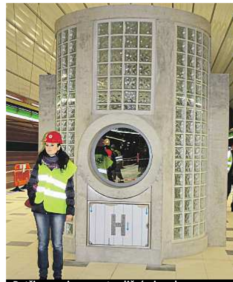
Petřiny zaujmou netradičními prvky.