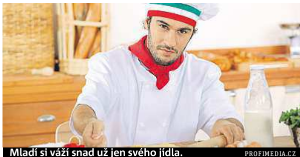
Mladí si váží snad už jen svého jídla.

na štíru s tím, aby porozuměli textu,“ tvrdě kritizuje 65letý Marazzini svoje krajany. „Důvodem, proč je Itálie tak otevřená cizím vlivům, je často nedostatek dobrých znalostí vlastní historie a jazyka,“ dodává Marazzini. „Kromě jídla, a dokonce i u něho je to méně než dříve, je italský občan často jakýmsi druhem osoby bez státní příslušnosti,“ tvrdí lingvista. ČTK