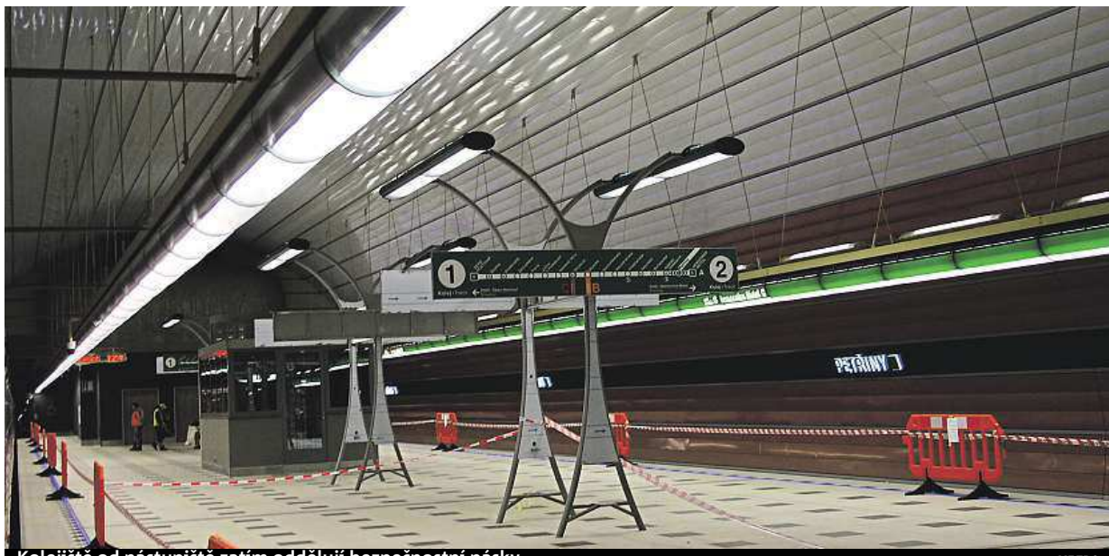
Kolejiště od nástupiště zatím oddělují bezpečnostní pásy.