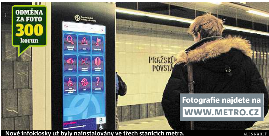
Nové infokiosky už byly nainstalovány ve třech stanicích metra.

Dopravní podnik začal měnit stávající informační kiosky v metru za nové interaktivní dotykové panely. V pilotní fázi projektu už byly instalovány ve stanicích metra Karlovo náměstí, Náměstí Míru a Pražského povstání. Dopravní podnik plánuje postupně rozmístit až šedesát dalších moderních informačních kiosků do dalších, především turisticky frekventovaných stanic metra. Vylep-