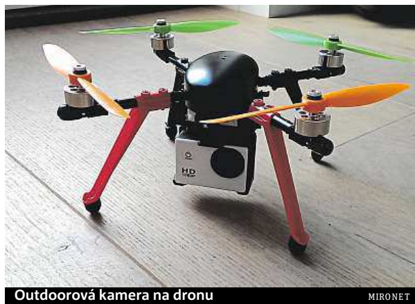
Outdoorová kamera na dronu

na to, kdy a kde jsme se odřeli a která boule na sjezdovce je odpovědná za naši zlomenou ruku. Zkrátka se kamera hodí i tam, kde nehrozí úrazy. Za takových okolností je pouzdro něco jako červená šipka nad hlavou: „Pozor, tady někdo natáčí!“ Donuťte potom „herce“, aby se chovali přirozeně... Za druhé, funkce pouzdra je držet ochrannou ruku nad kamerou uvnitř. Na souši chrání před nárazy, ve vodě před mokrem. Pokud kamera přistane na kameni, může se pouzdro rozpadnout na kusy a vnitřek