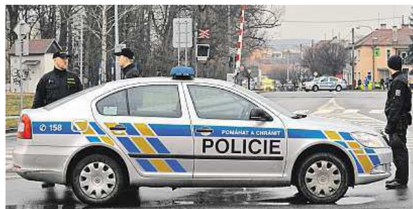
Manévry. Policie musela zastavit kvůli střelbě dopravu.

• Střelec byl podle Jelena zřejmě sociální člověk, ve kterém podobný nápad uzrával již déle. V takovém člověku prý agrese průběžně zeslabuje a zesiluje, nemusí být ale rozeznatelná.