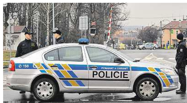
Manévry. Policie musela zastavit kvůli střelbě i dopravu.