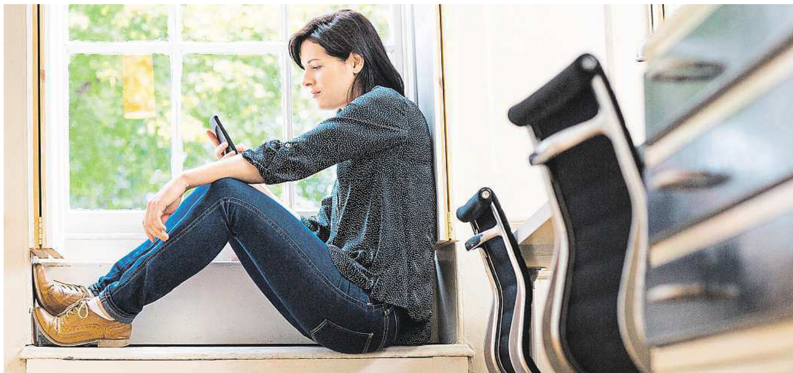
Na pracovních počítačích se Češi chovají obezřetněji, ale roste soukromé surfování na firemních chytrých mobilech a tabletech.